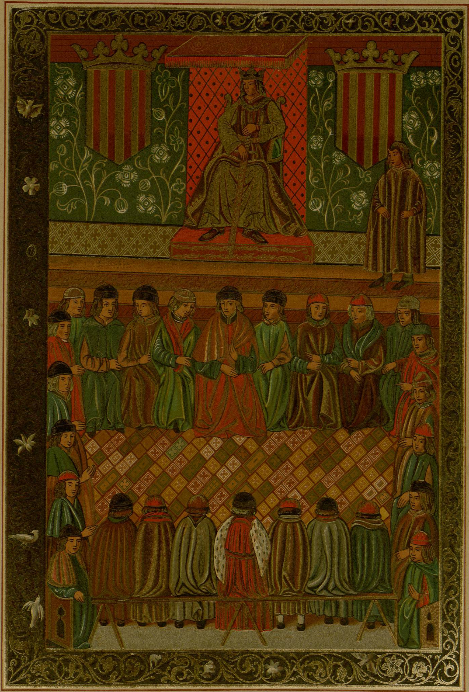
DON JAIME I PRESIDENDO LAS CORTES DE LÉRIDA A 3 DE LOS IDUS DE MARZO DE 1242. Miniatura de un grabado impreso al frente de la edición incunable de las Constituciones de Cataluña.

DON JAIME I PRESIDENDO LAS CORTES DE LÉRIDA