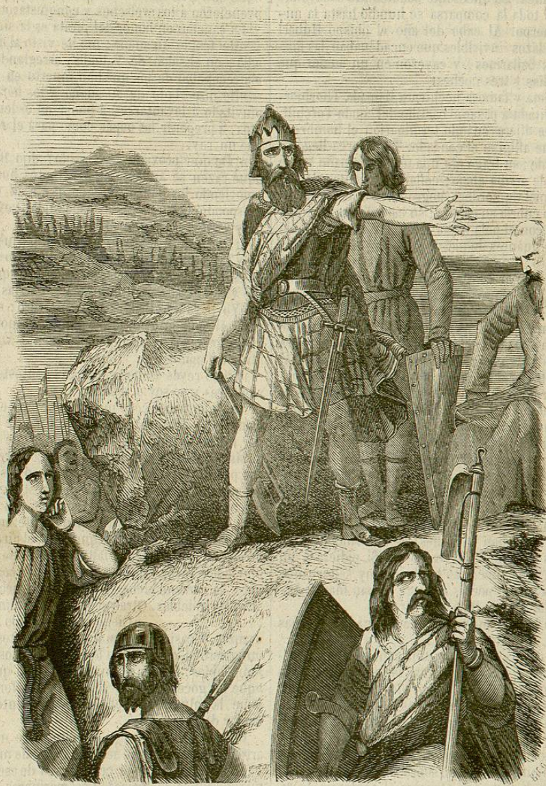
GALGACO Y SUS COMPAÑEROS.

Los dinamarqueses trajeron consigo sus escaldas y estos se mezclaron con los bardos galos. Tres cosas no podía perder por razon de deudas el hombre libre del país de Gales: su caballo, su espada y su harpa. Los pueblos enteros en su edad heroica son poetas: cantaban en la guerra, cantaban en el festín y canta-