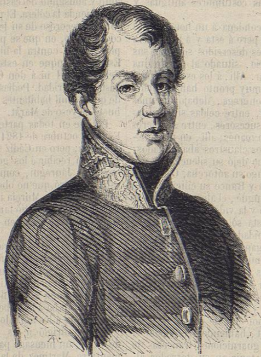
D. RAFAEL DEL RIEGO.

Estas segundas córtes fueron á las primeras lo que la asamblea legislativa francesa fue á la asamblea