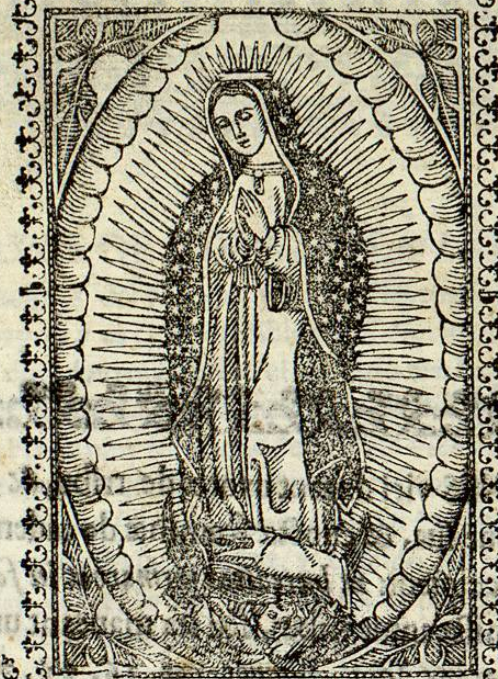
Dico ego opera mea Regina. Psalm. 44. v. 2.

VIDI coelum novum: & Civitatem Jerusalem novam. = Ecce tabernaculum Dei cum hominibus, & habitavit cum eis. Et ipsi populus ejus erunt: & mors ultra non erit, neque luctus, neque clamor, neque dolor. Apocal. c. 21. v. 1. 2. 3. & 4.