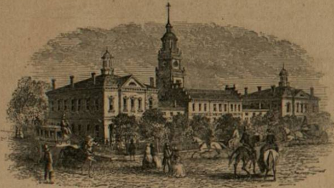
Cara de Ayuntamiento en Filadelfia.