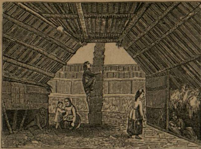
Chozas subterranas en las rejiones setentrionales.

Porque sabia que la Tierra era redonda, y creia que podria dar la vuelta por el otro lado.