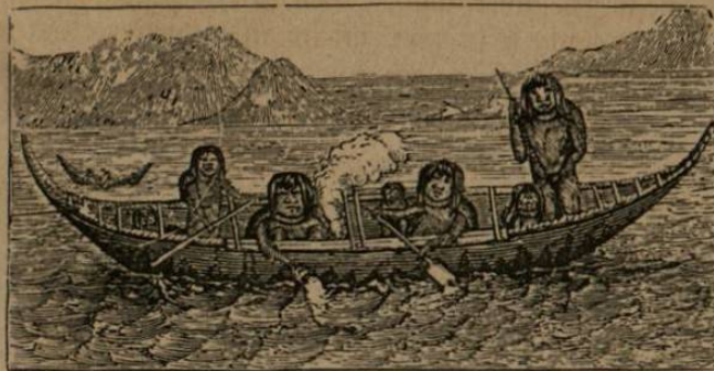
Habitantes naturales de la Tierra del Fuego, isla que queda cerca de la parte meridional de este continente. Son morenos, se pintan, y solo se cubren con una piel de foca.

Mandó ministros para tratar con el General Urquiza para la libre navegacion de los rios Paraná y Uruguay, asegurando así un porvenir brillante á una y otra República.