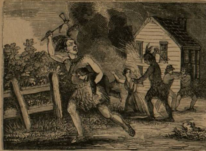
Indios atacando á los primeros colonos.

Que despues de la Inglaterra, su comercio es mayor que el de toda otra nacion del mundo.