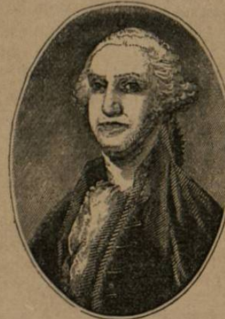
Gen. Washington, primer Presidente de los Estados Unidos.