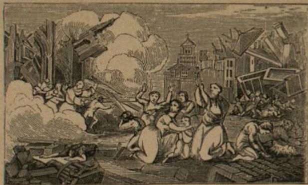
Terremoto de Mendoza en 1861.

Qué desastre tuvo lugar en Mendoza el 20 de marzo de aquel año?