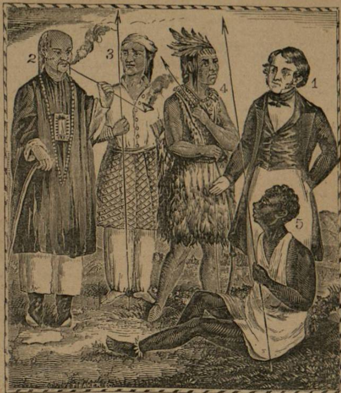
1. EUROPEO. 2. CHINO. 3. NATURAL DE LA MALECIA. 4. INDIO NORTE-AMERICANO. 5. AFRICANO.