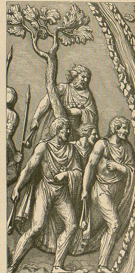
Honderos germánicos (Bajo relieve de la columna de Marco Aurelio)

concede tierras á los frisones y les impone «un senado, magistrados y leyes;» y Marbod, cuando organiza el reino marcomano, se inspira en lo que ha visto de las instituciones romanas. En cambio, introdúcense en Roma las modas bárbaras: Caracalla adopta el traje y el peinado de los germanos y las damas romanas se enamoran de los rubios cabellos de las germanas, y con germanas se casan los veteranos y los ciudadanos de Roma que se establecen en las fronteras. La ley que Valenti-