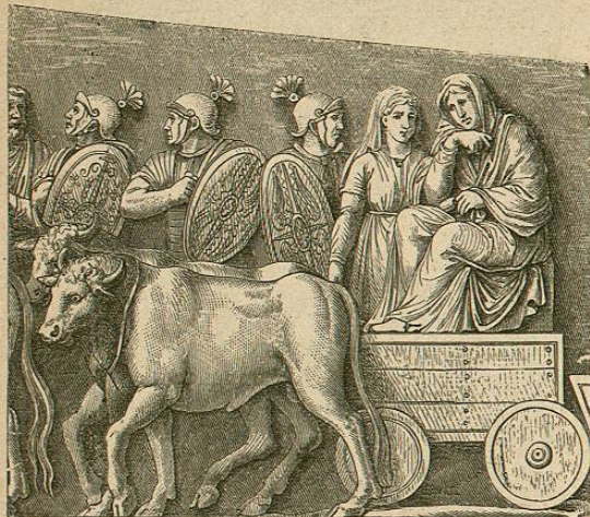
Carro germánico tirado por bueyes (Bajo relieve de la columna de Trajano)

Las numerosas palabras del idioma latino que penetraron en los idiomas germánicos atestiguan asimismo