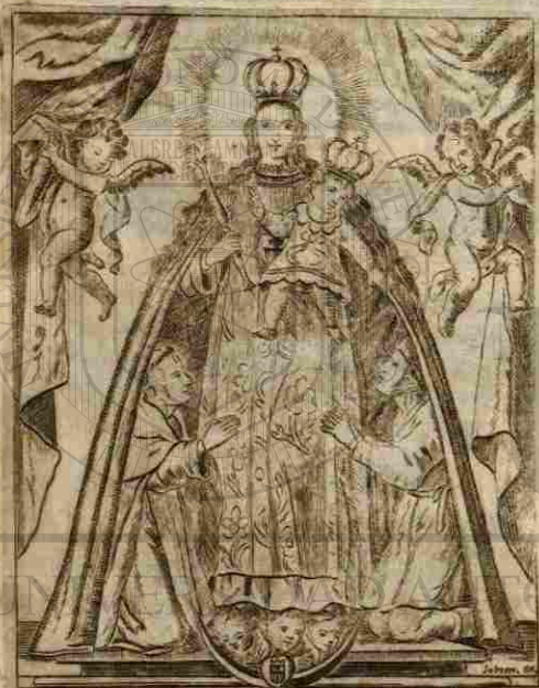
R. de N. S. de la Merced que se venera en el Altar M. de su Convento de Mexico.

Adeuocion de un Religioso menor Siervo de la S.