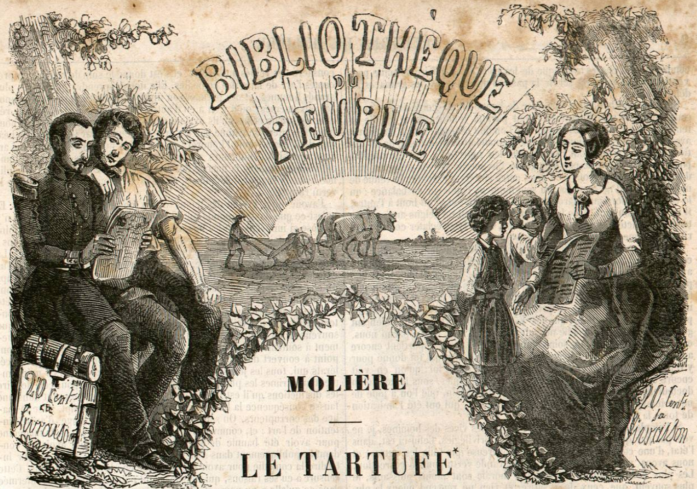
Dessins par Lorentz, Jules David, etc.