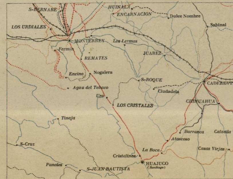
DIAGRAMA DE OPERACIONES.

Notas: 1 a —Las altitudes están inscritas en metros con tinta azul. 2 a —La explicación de signos, caracteres y abreviaturas consta en el Reglamento respectivo formado por la Comisión Geográfica. 3 a —Las posiciones geográficas, que corresponden a puntos situados en las hojas contiguas, se marcan con (*).