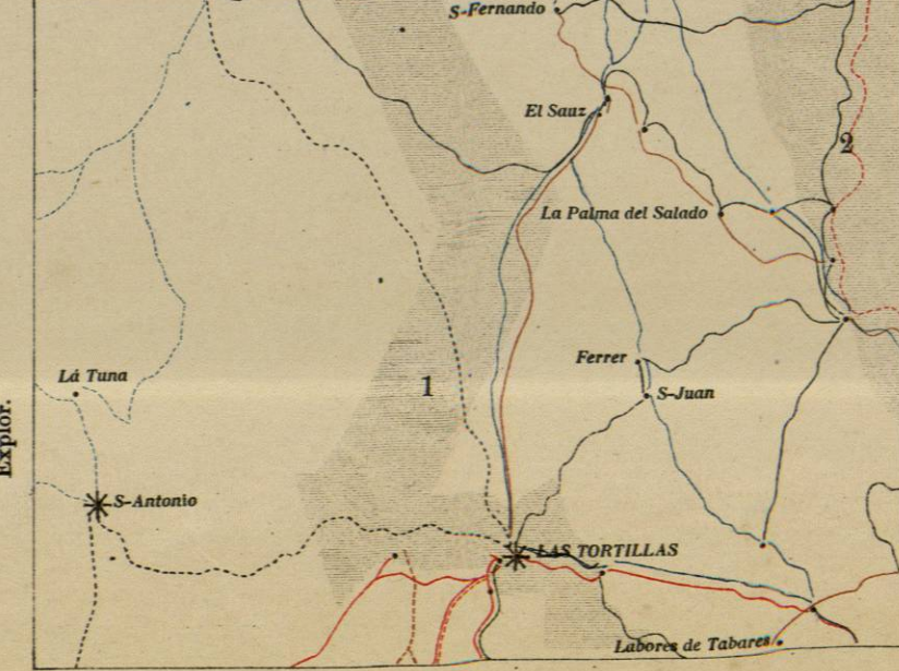
DIAGRAMA DE OPERACIONES.