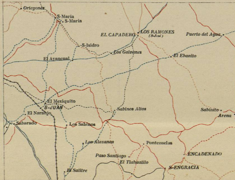
DIAGRAMA DE OPERACIONES.

NOTAS: 1 a -Las altitudes están inscritas en metros con tinta azul. 2 a -La explicación de signos, caracteres y abreviaturas consta en el Reglamento respectivo formado por la Comisión Geográfica. 3 a -Las posiciones geográficas que corresponden a puntos situados en las hojas contiguas, se marcan con (*).