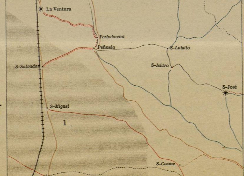
DIAGRAMA DE OPERACIONES.

Terminada en 1904.-Publicada en 1904. Zinc de la Com. Geogr. Explor.