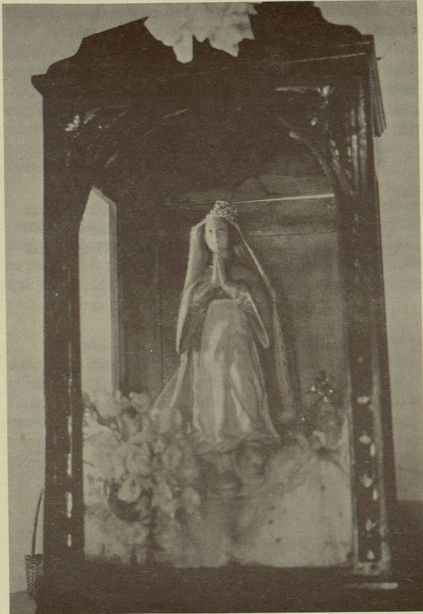
Antigua imagen de la Virgen de la Concepción, se cree trajeron los primeros pobladores.