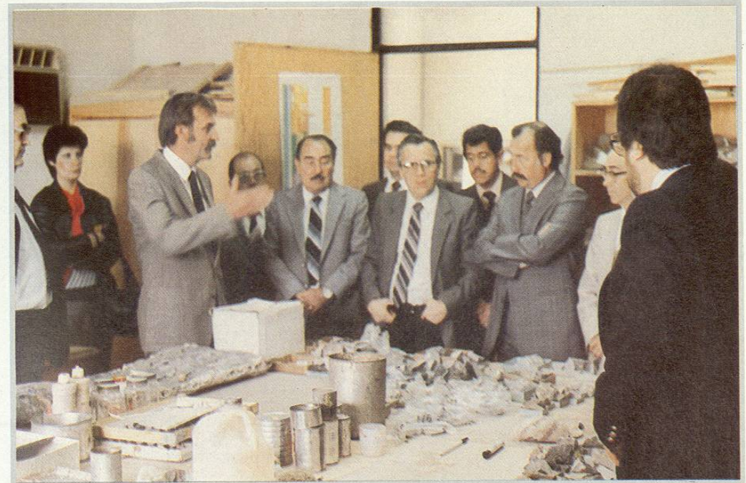
Visita de los Miembros de la H. Junta de Gobierno y la H. Comisión de Hacienda de la U.A.N.L.