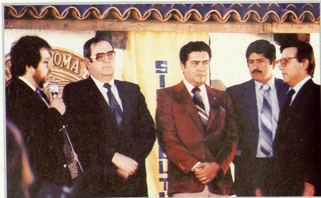
Otro aspecto de la toma de protesta