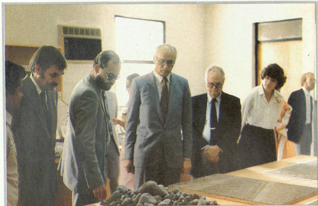
Visita del Embajador de la República Federal de Alemania