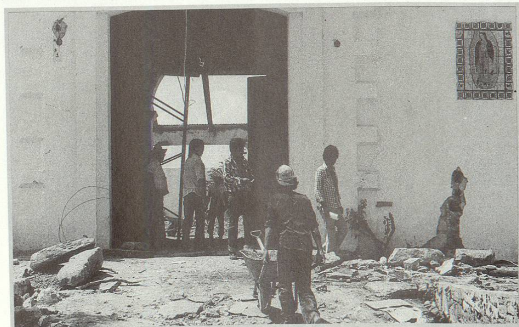
Trabajo de remodelación de la Ex-hacienda de Guadalupe