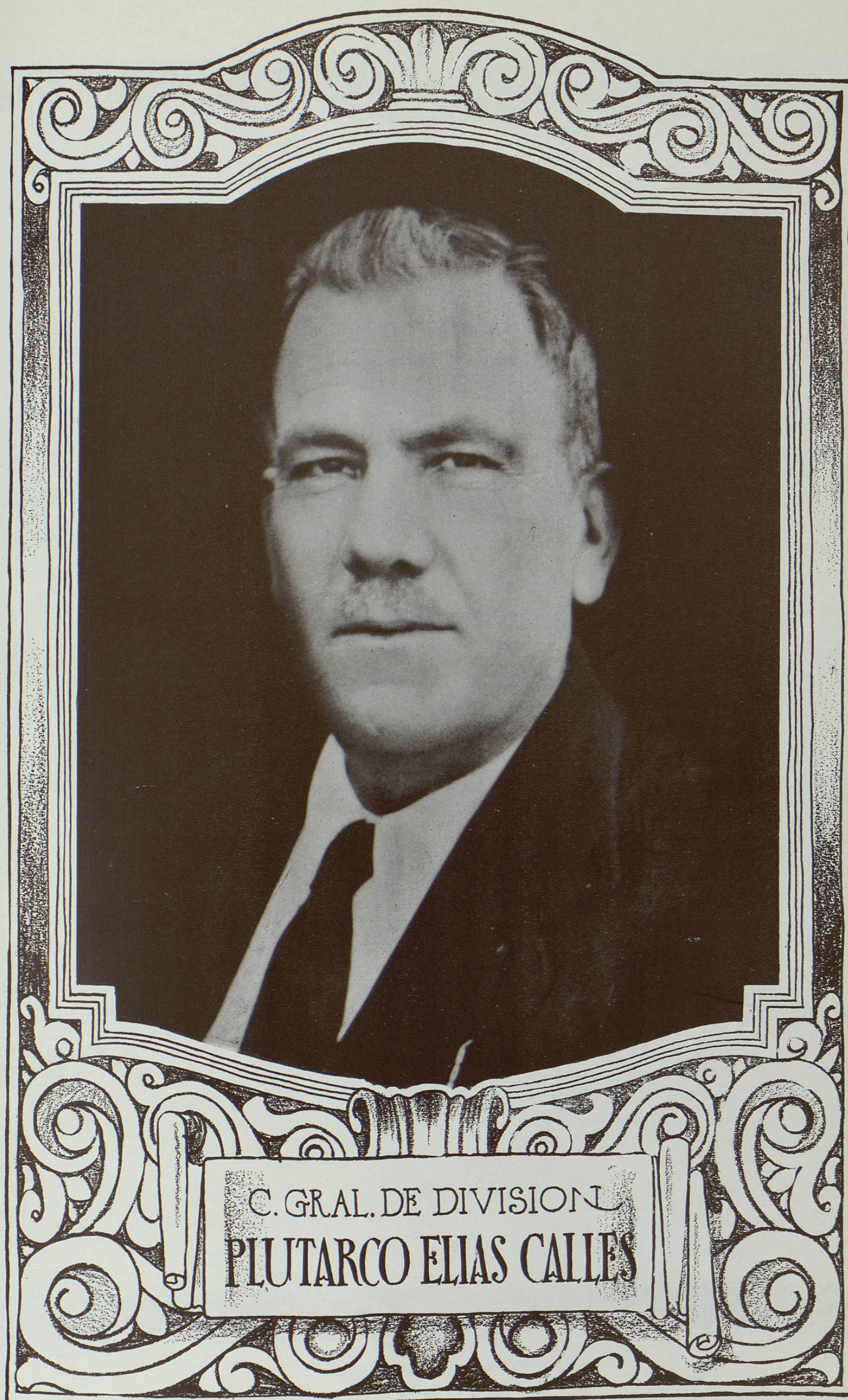
C. GRAL. DE DIVISION PLUTARCO ELIAS CALLES