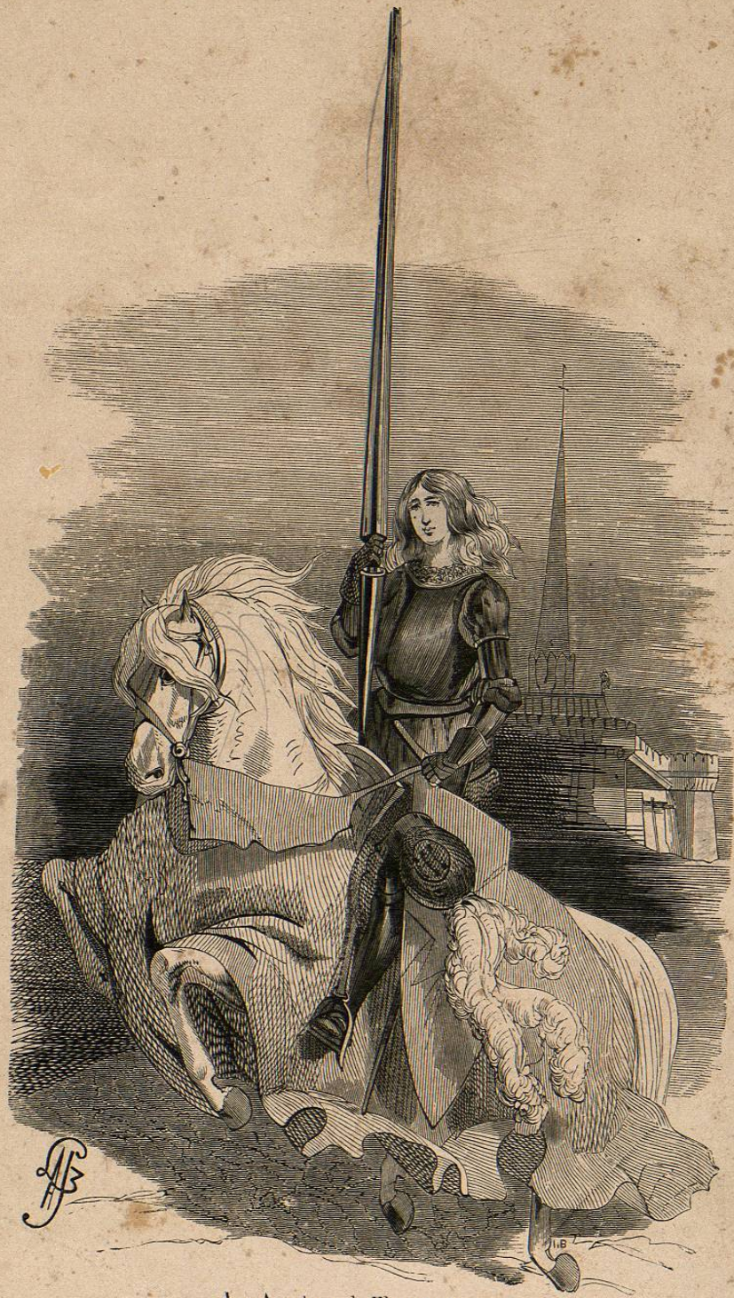
Les Aventures de Fleur-de-Lys.

[The right page of the book is mostly blank, showing significant water damage and discoloration. Faint, illegible text is visible through the paper from the reverse side.]