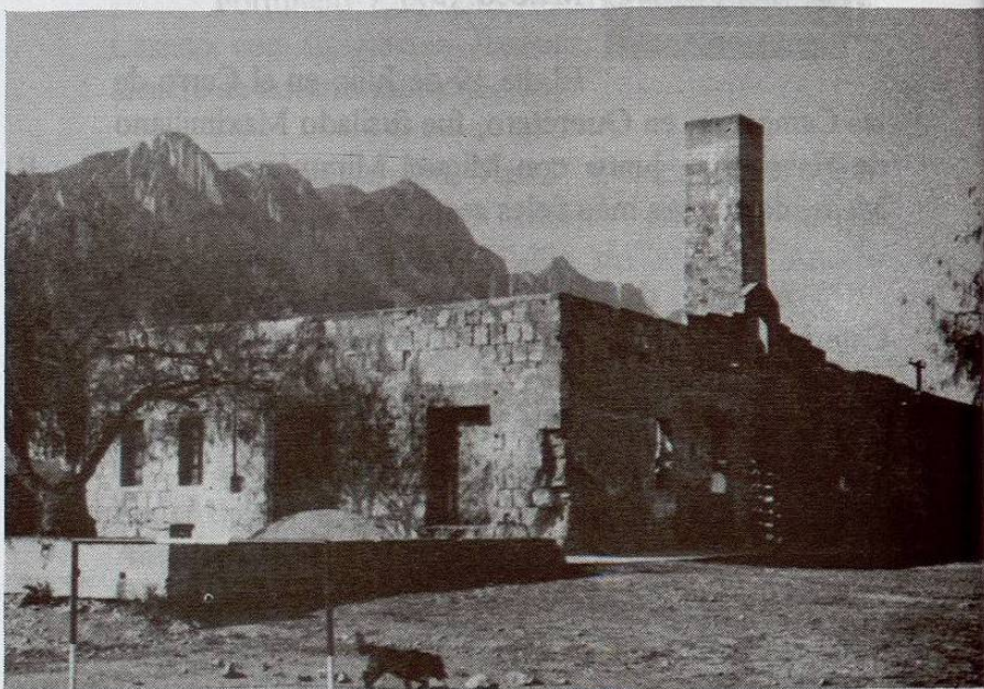
El Blanqueo.

Se estableció en las inmediaciones de La Fama una factoría, hay quienes establecen que era una fábrica de cartón. Hoy es una construcción abandonada conocida como El Blanqueo.(58)