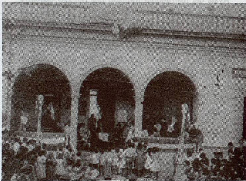
El palacio municipal después de la remodelación