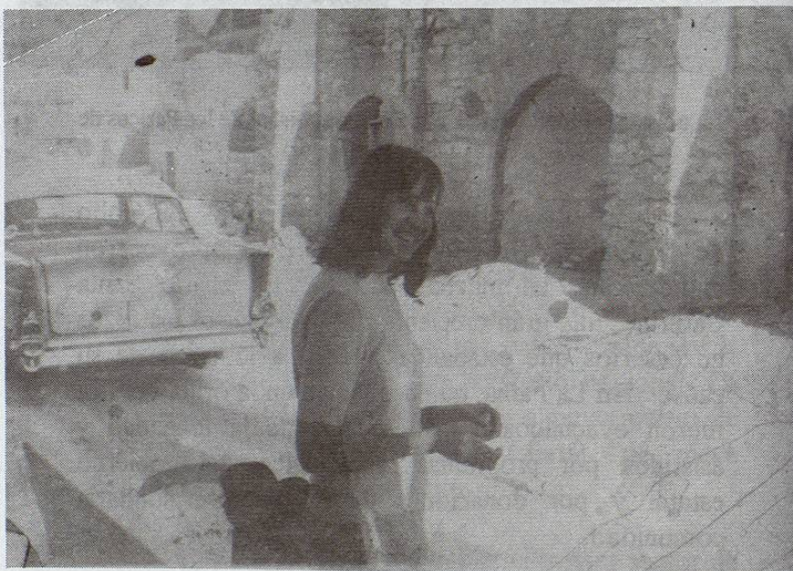
La demolición de la atarjea

El presidente de la república era Gustavo Díaz Ordáz período 1964-1970.(E)