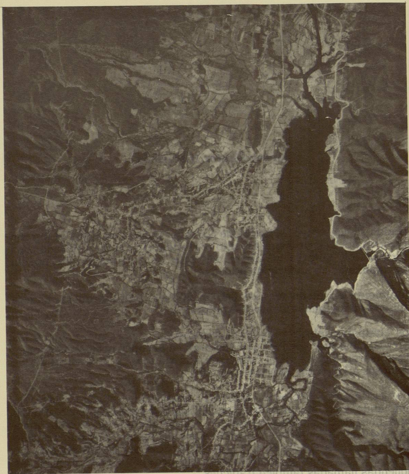
Fotografía aérea de la actual zona conurbada de Santiago, N.L. que incluye la cabecera municipal Villa de Santiago, donde se ubica la iglesia, El Cercado, San Pedro de los Salazares, San Francisco, San Javier, La Cieneguilla, San José Norte y Sur y Huajuquito ahora conocido como Los Cavazos.