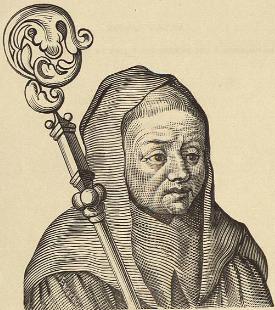
SAN BRENDANO, ABAD CLUAIN-FERTENSE, EL ADMIRABLE PEREGRINO EN EL OCÉANO.

Retrato tomado de la obra "Nova Typis Transacta Navigatio," publicada por Fr. Don Honorio Philopono, Benedictino, en el año de 1621.