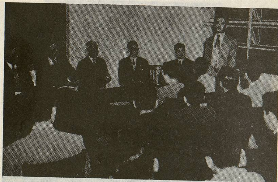
(6). Primer Presidente de la Sociedad de Alumnos.