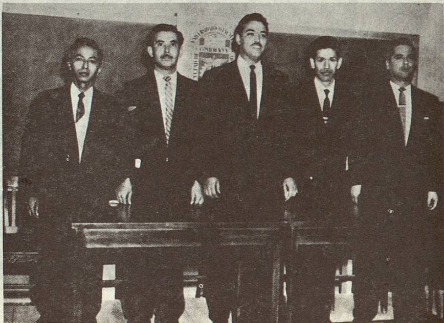
(7). Primera Generación.