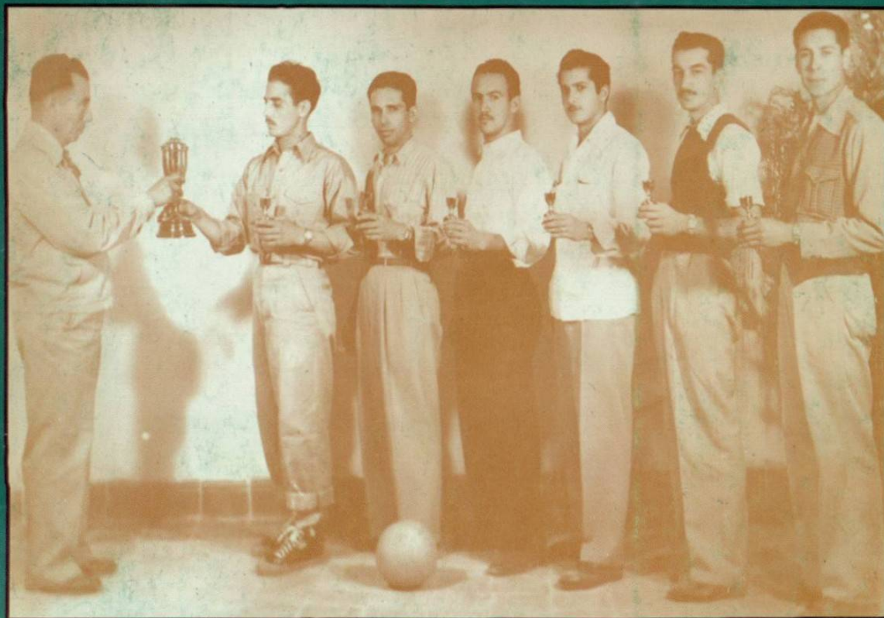
EQUIPO CAMPEON DEL SEGUNDO TORNEO ABIERTO DE VOLEIBOL VARONIL "SOCIEDAD MUTUALISTA", 1946.