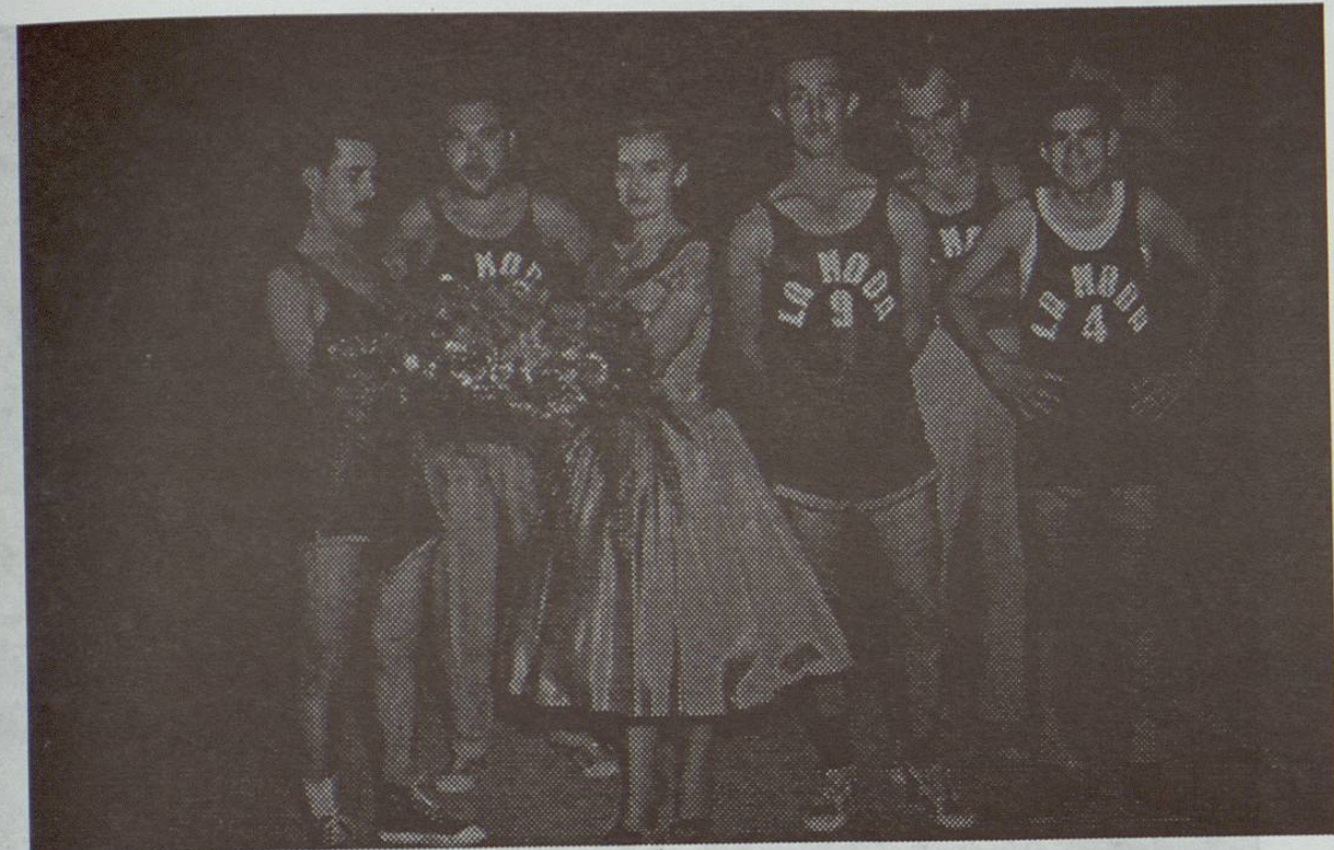
Equipo de Basquetbol Taller de Vestidos La Moda, cuarto lugar del IX Campeonato Municipal de Mayores de 1956. Cancha de la Esc. Sec. Profr. "Antonio Solís", hoy Casa del Maestro de la Sección 50 del SNTE.