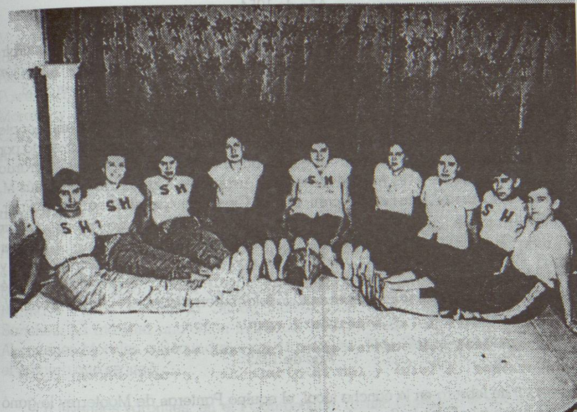
EQUIPO DE BASQUETBOL "SABINAS HIDALGO" CAMPEON DEL ESTADO. Julio 9 de 1952.

Se jugó de noche en la cancha de la Esc. Sec. Profr. "Antonio Solís". Obsérvese el balón y los tenis de aquel tiempo.