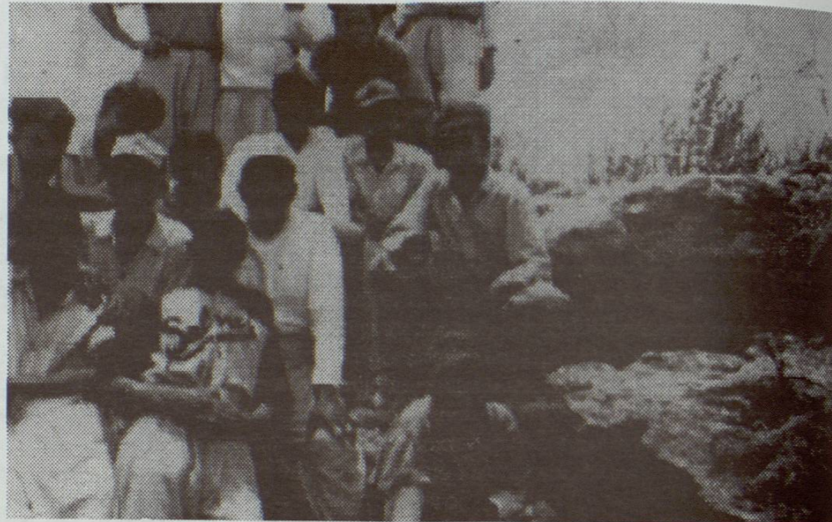
Equipo de beisbol Sabinas Hidalgo, en el Ayaleño, Vallecillo, Nuevo León