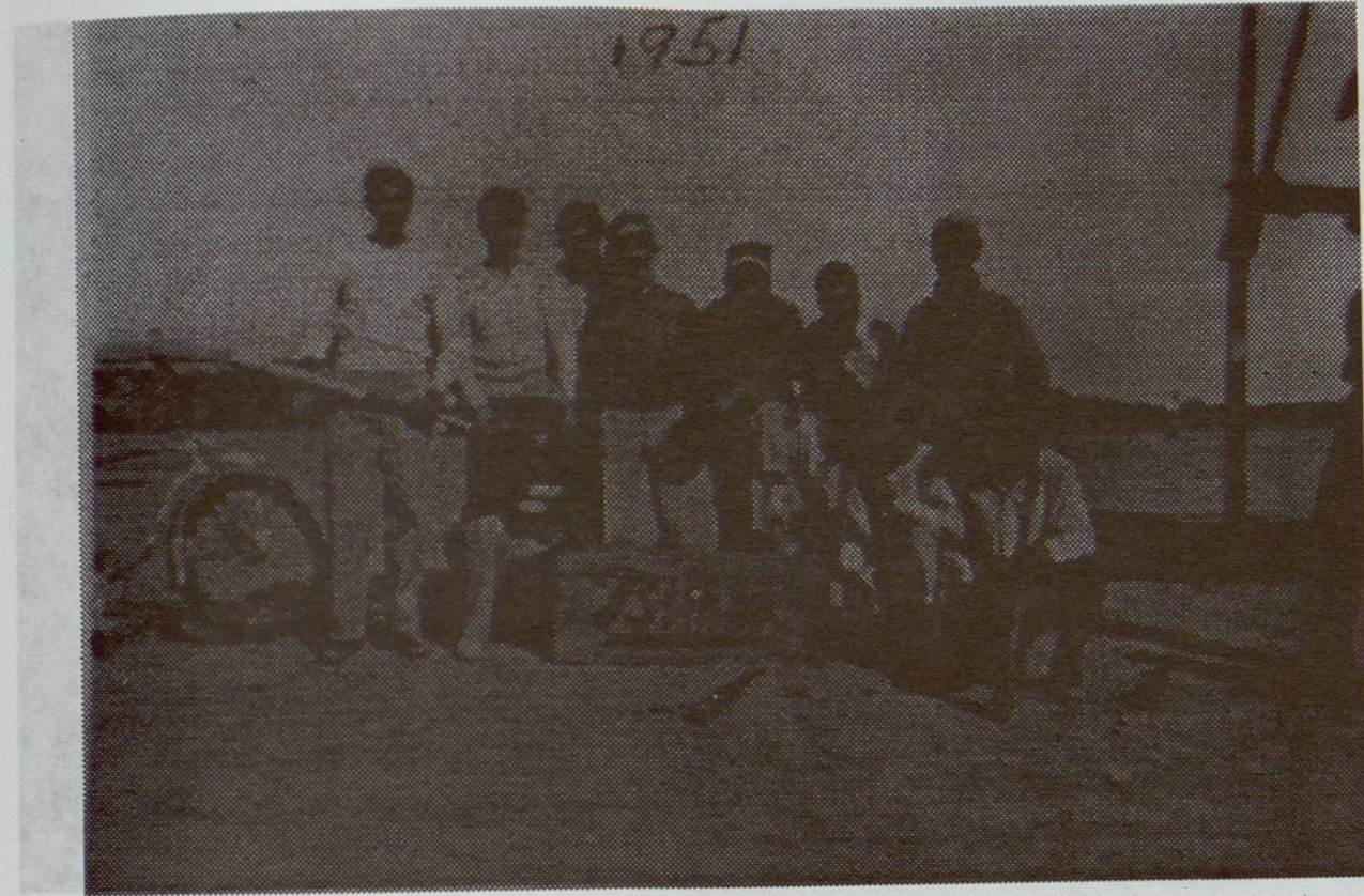
Equipo Refrescos Bimbo de Beisbol. Campeón del I Torneo Municipal. Campo SOP. 1951. (Mayores)

Se conserva como reliquia histórica y mudo testigo de tal aseveración para los todavía incrédulos, de un pequeño BANDERIN, raído y descolorido, que en su momento oportuno será mostrado a propios y a extraños, junto con el BATECITO, que no se duda estará a la vista para ser admirado en un lugar a la altura de la Historia Deportiva y muy nuestra.