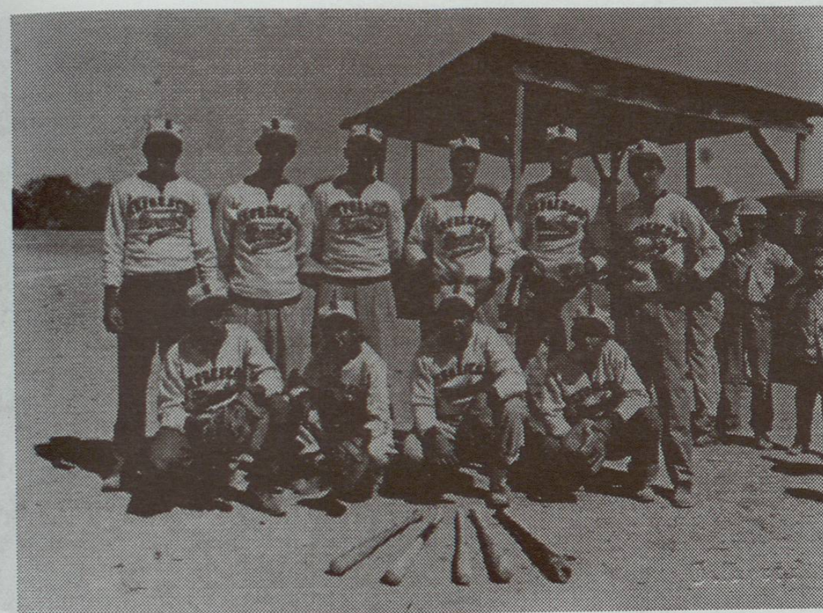
Equipo de Beisbol Refrescos Bimbo. Campeón del II Torneo Municipal. Campo SOP. 1952. (Mayores).

* Gráficas como la presente alimentan el espíritu de los deportistas.