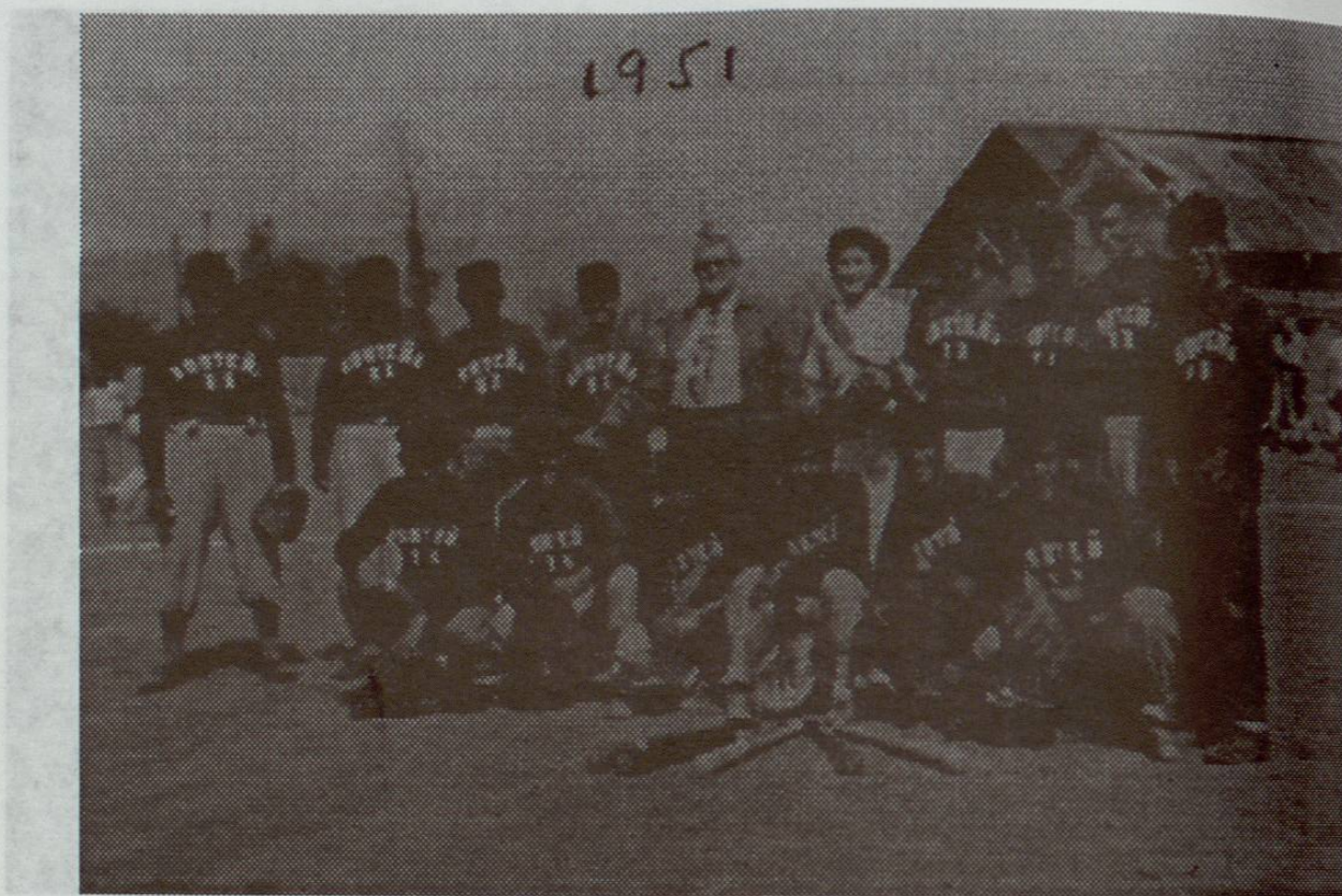
Equipo de beisbol La Norteña XX, Tercer Lugar en el Campeonato Municipal de Beisbol de Mayores, en su I Edición de 1951. En el campo de la Dirección de Caminos de la SCOP o SOP al norte de la población.