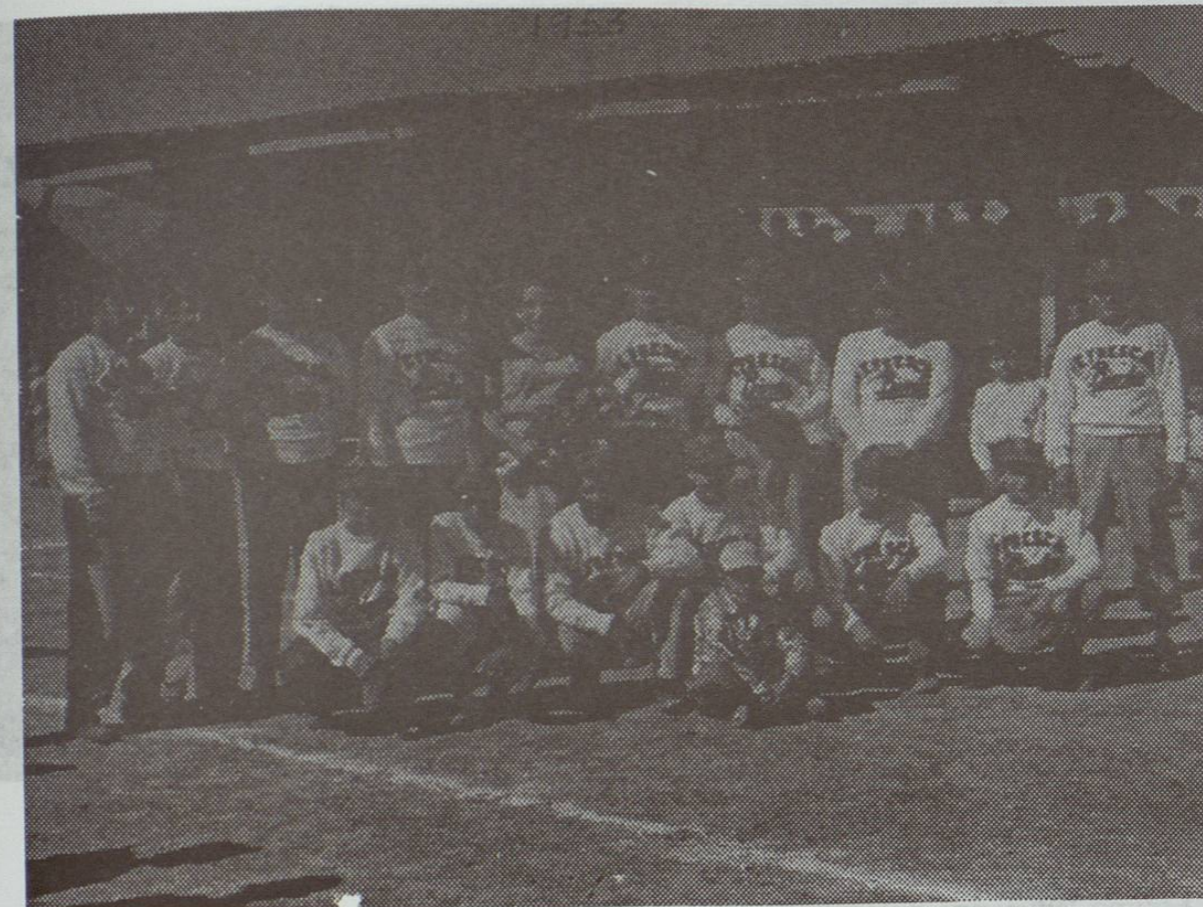
Refrescos Bimbo Subcampeón de Beisbol Municipal de Mayores 1953. Campo SOP. Tercera Edición.

* Los conscriptos asistían a presenciar los emocionantes juegos.