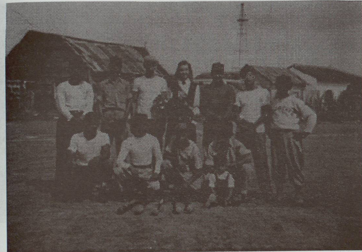
Equipo de Beisbol Peña Blanca del Aguacate, quinto lugar en el Campeonato Municipal de Mayores. En la III Edición de 1953. En el campo de la SOP o SCOP en la Dirección de Caminos, al norte de la población y del lado oriente de la Carretera Nacional.

* Los jugadores escualos portan spikes y zapatos para jugar.