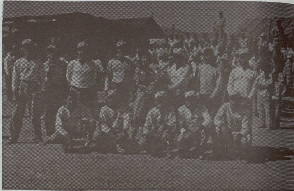
Equipo Tiburones del Café K-Cero, Cuarto lugar del III Campeonato Municipal de Mayores. 1953 Campo de la SCOP al norte de la población.