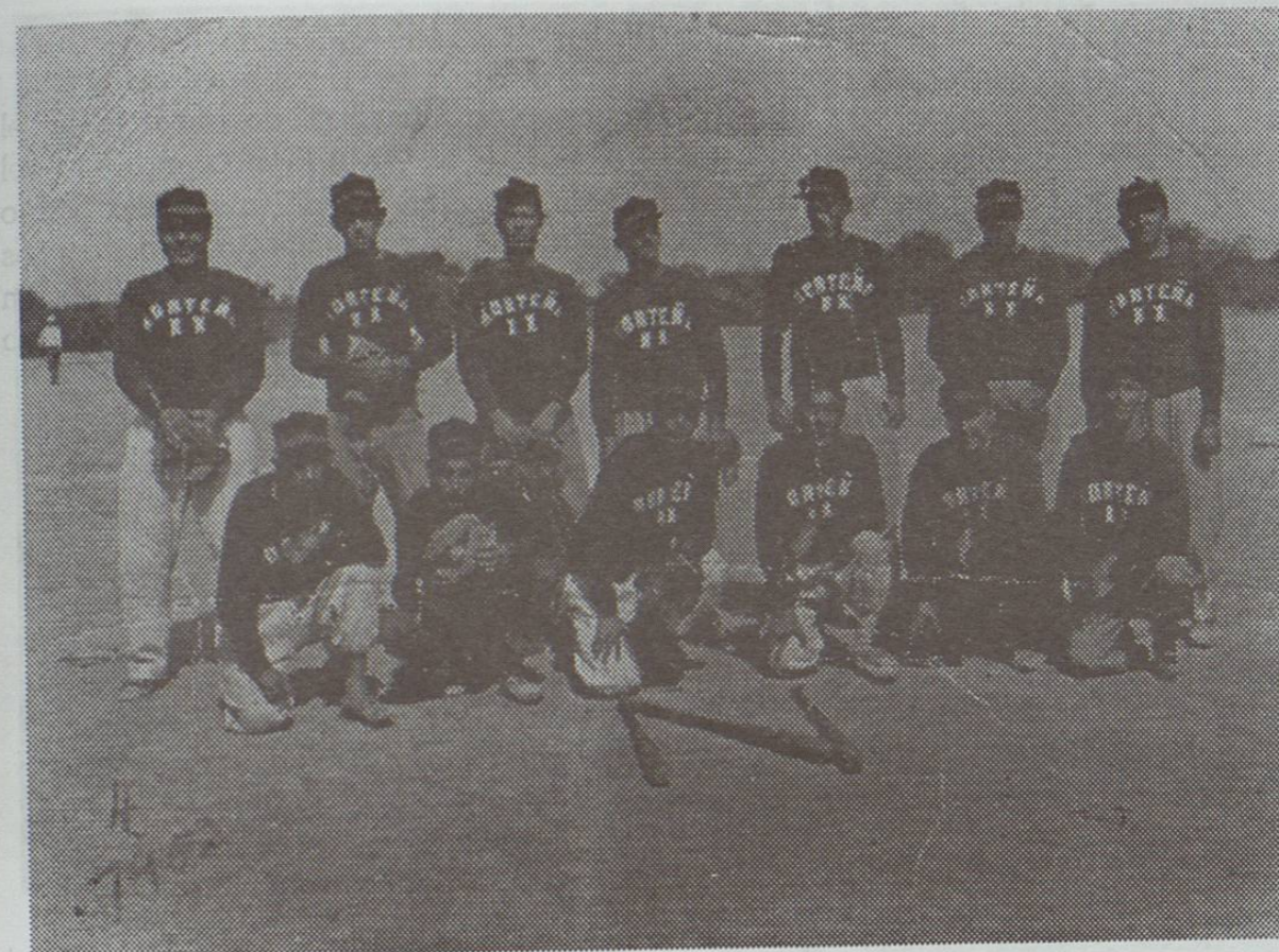
Equipo de Beisbol La Norteña Cuarto Lugar en el II Campeonato Municipal de Mayores. Abril de 1952 en el Campo SOP al norte de la población.

* Con los bates formaron el nombre del equipo K - O