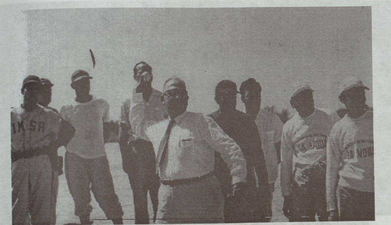
Inauguración de la V Temporada de Beisbol Municipal de Mayores el 21 de junio de 1955. Parque Gilberto Garza en Bella Vista. Y juego amistoso con un equipo de Monterrey, N. L.