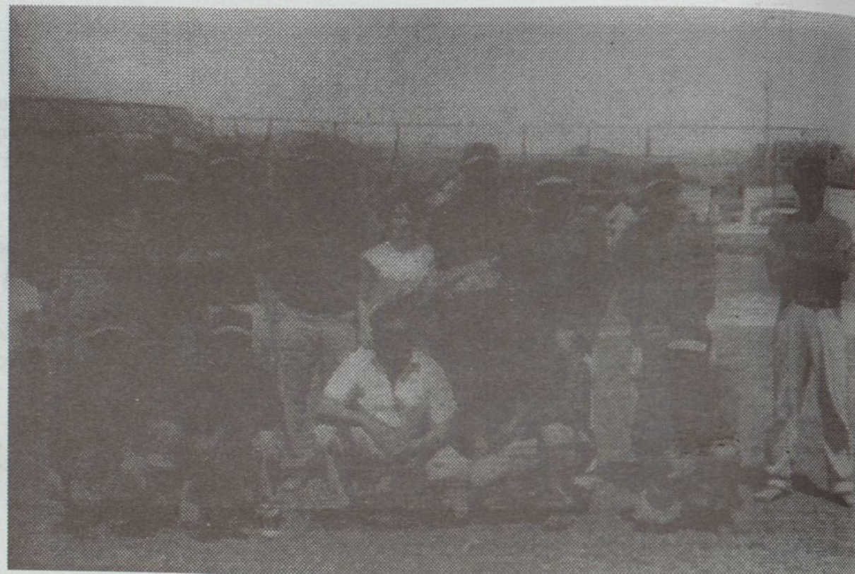
Equipo Subcampeón de Béisbol: Club de Leones, A.C. 1957 VII Campeonato Municipal de Mayores.