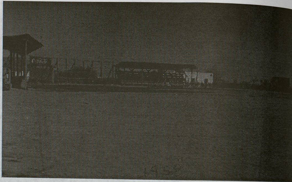
Parque de Béisbol "Gilberto Garza", en Bella Vista 1958.

* Observar: La pizarra por tercera base y el inicio de la siembra del césped atrás de home. Más tarde luciría como Catedral del Béisbol, y como uno de los parques más cuidados del Norte del país.