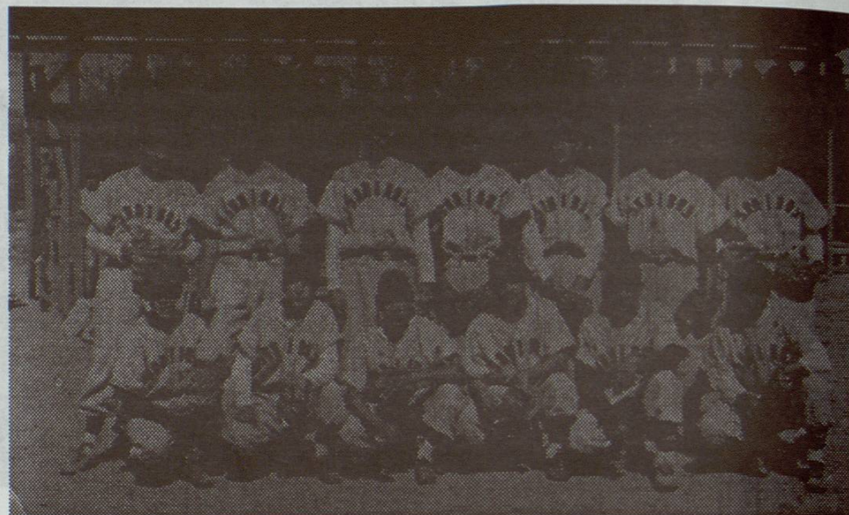
Otra pose de la Selección Sabinas Hidalgo, N. L. Selección de Beisbol Municipal. Julio de 1955. Parque Gilberto Garza en Bella Vista.