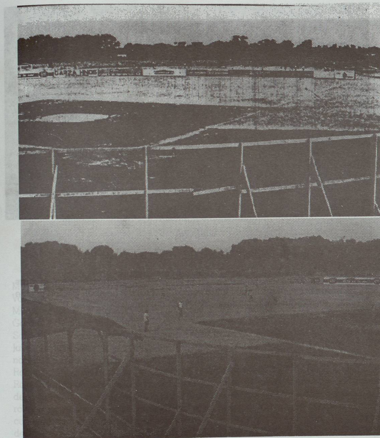
Parque de Béisbol "Gilberto Garza" Bella Vista 1958 Aspecto que presentaba el parque en 1958.