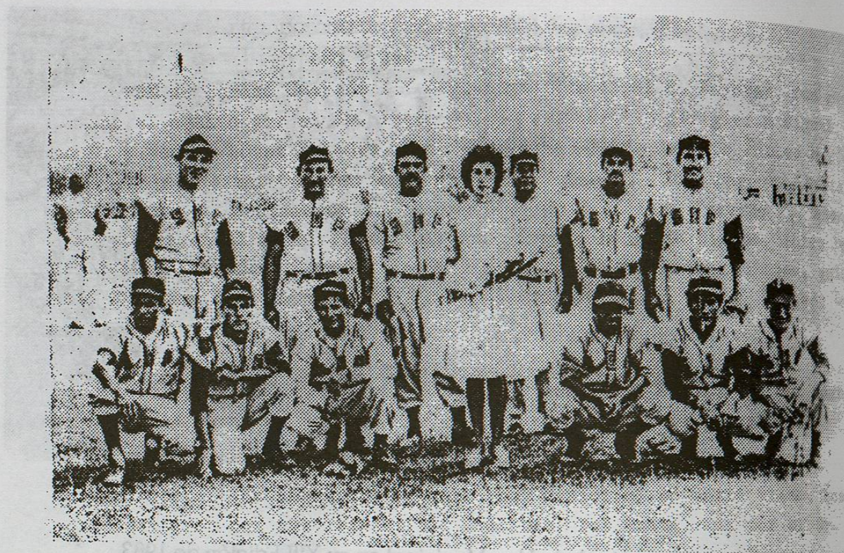
Equipo de Béisbol SOP 1963. XIII Campeonato Municipal de Béisbol de Mayores. Parque Gilberto Garza, en Bella Vista