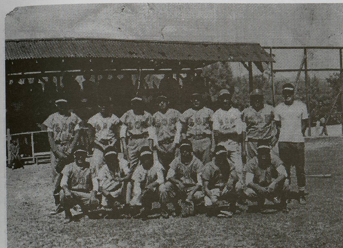
Equipo SOP Campeón de la XV Temporada Municipal de Béisbol de Mayores 18 de Abril de 1965. Bella Vista.