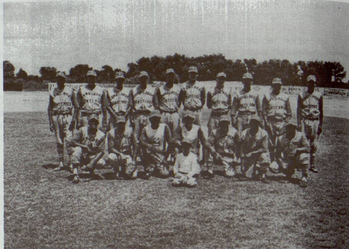
Selección Sabinas Hidalgo de Béisbol 1964, Acumuladores Monterrey Parque Gilberto Garza en Bella Vista.