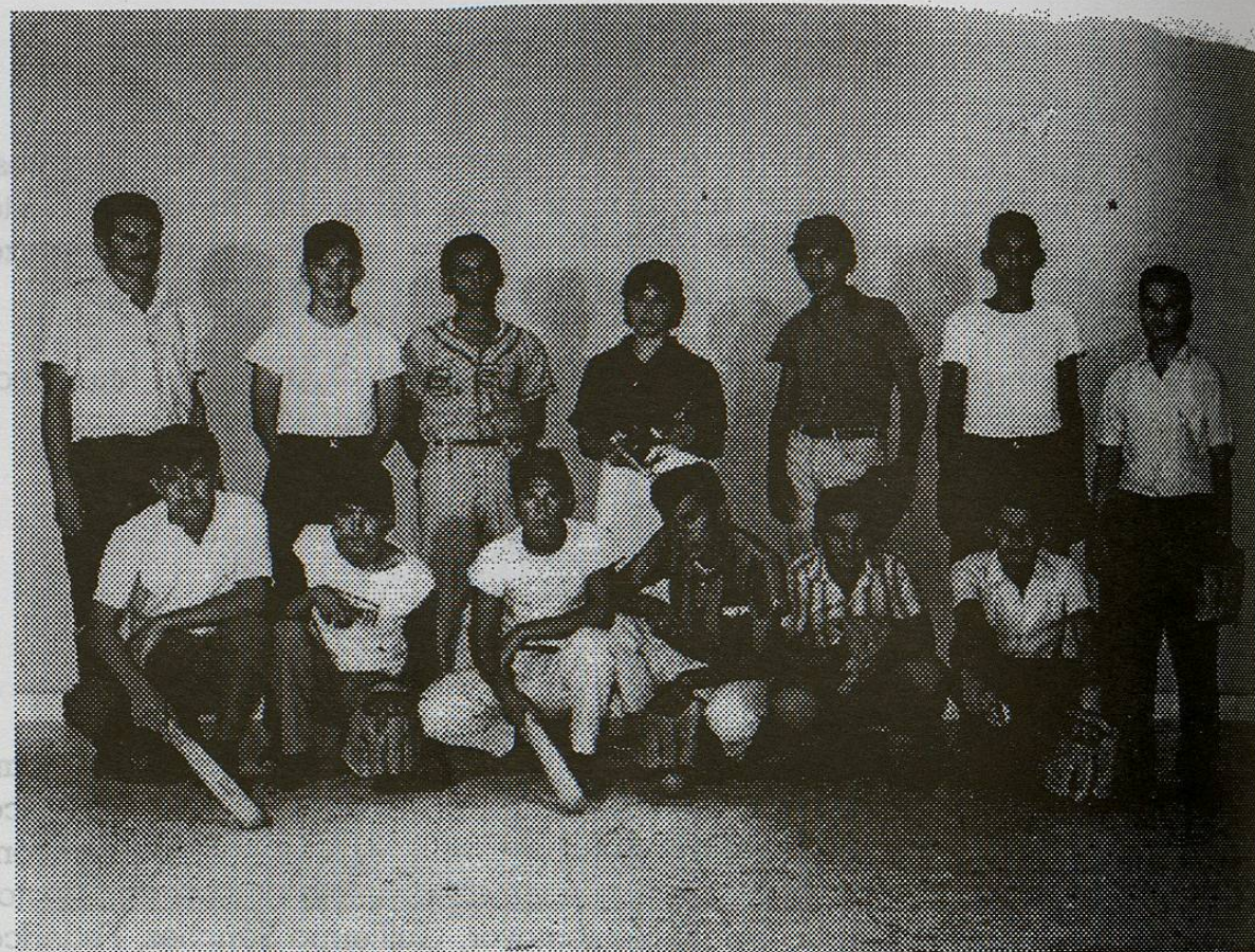
Equipo de Béisbol Centro de Seguridad Social # 4. Campeón Municipal Juvenil del IV Evento en Septiembre de 1965.