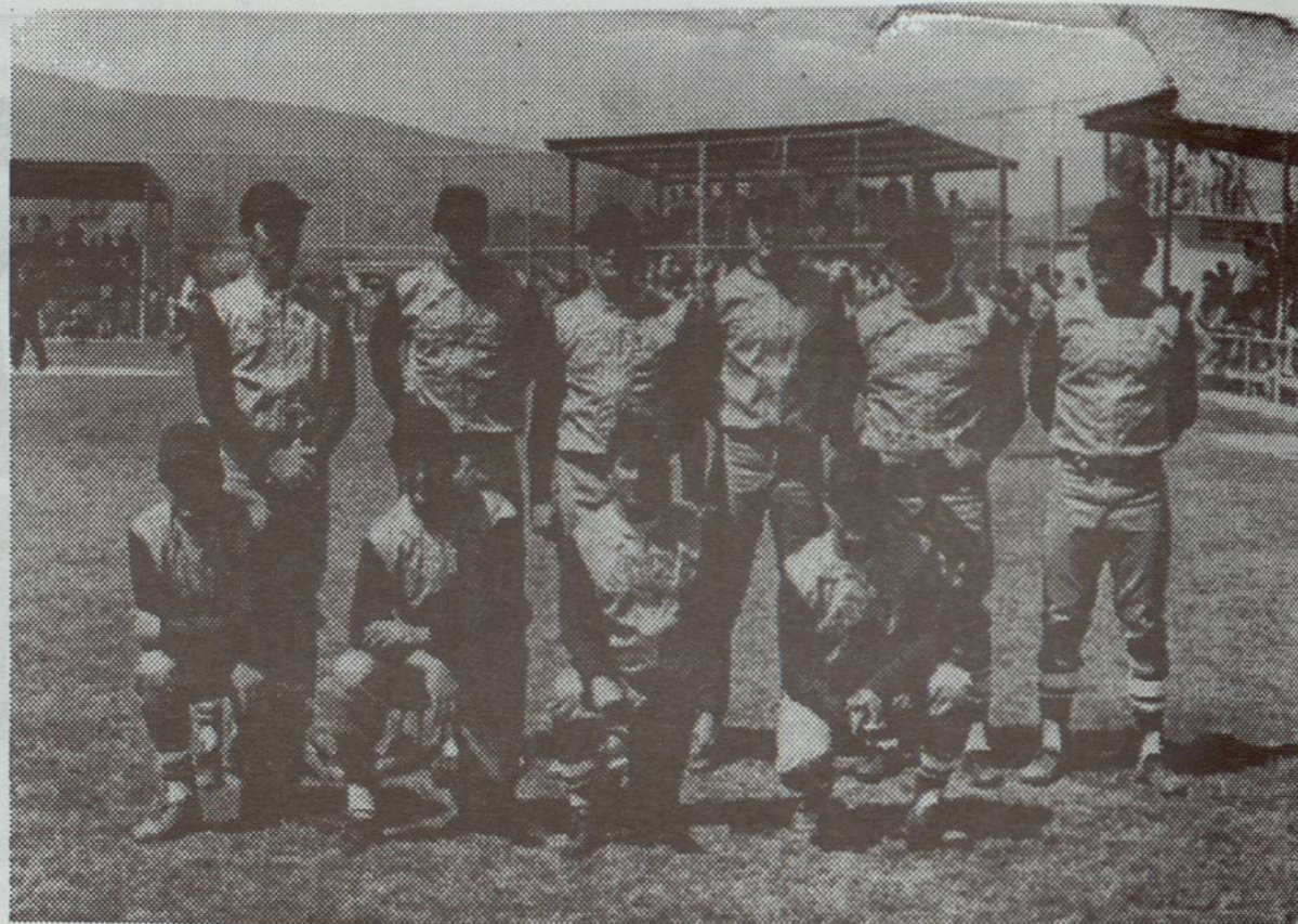
Seleccionados Sabinenses en la Liga Regional Naranjera de 1970, Equipo Mathes en su Segunda Participación.

La primera fue en 1969 con el nombre de "Autobuses Rojos".