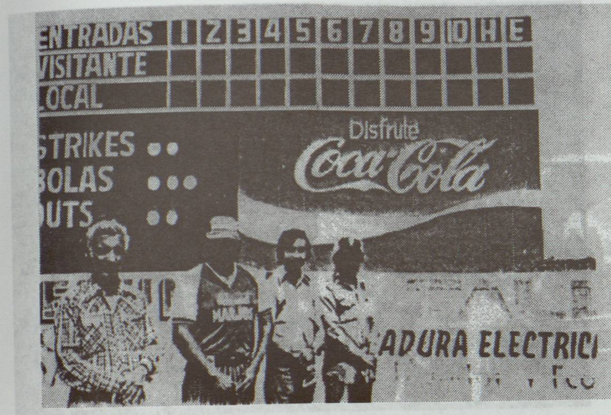
Pizarra de la Unidad Deportiva "Aléctor Ruiz" Parque de Béisbol "Gilberto Garza" en Bella Vista 20 de Mayo de 1978