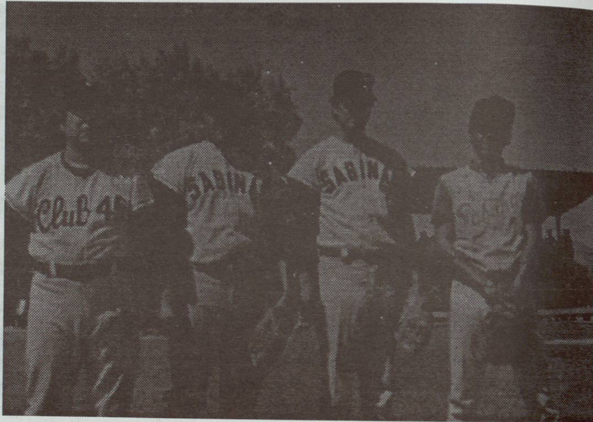
Liga Naranjera, III Edición Julio de 1971 Parque Gilberto Garza en Bella Vista