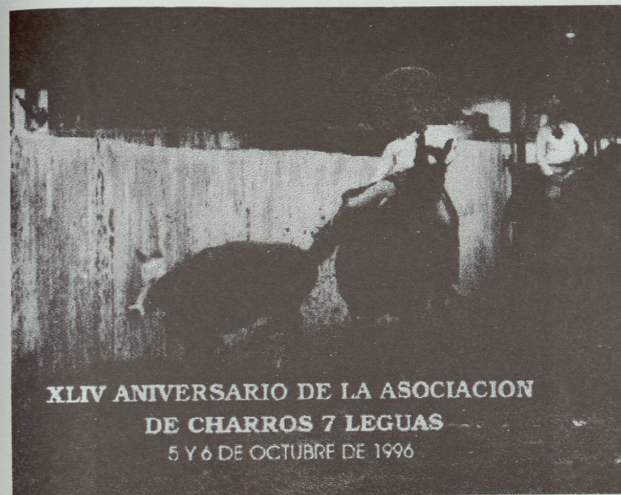
XLIV ANIVERSARIO DE LA ASOCIACION DE CHARROS 7 LEGUAS 5 Y 6 DE OCTUBRE DE 1996

Esta foto se publicó en el periódico "El Porvenir" de Monterrey, y ese ejemplar el 20 de septiembre fue depositado en una cápsula y fue a dar a la fosa que será abierta en el año 2046, para que la juventud de Sabinas Hidalgo se entere de quienes eran las personas que orgullosamente habían nacido en Sabinas.