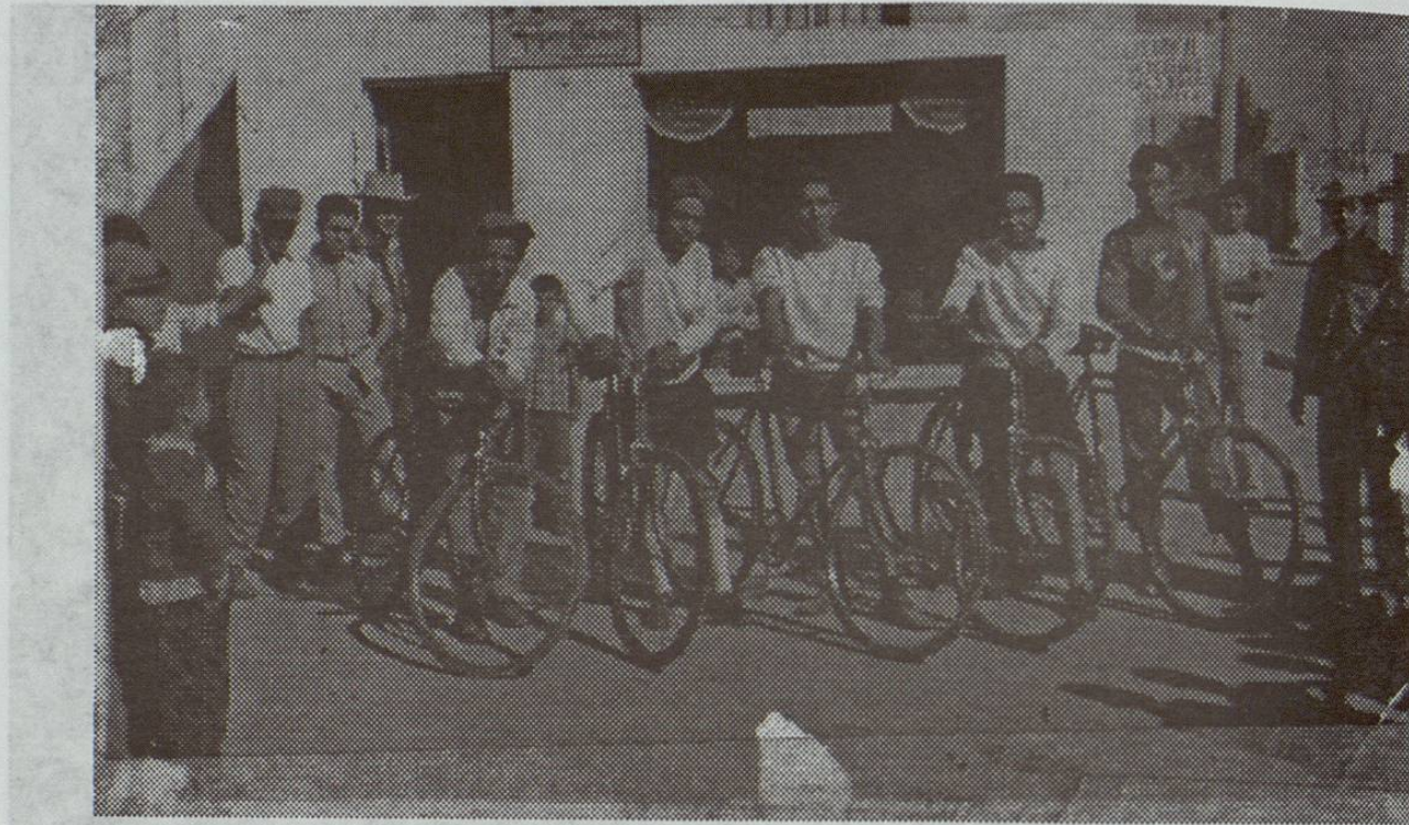
Participantes de la IV Carrera Ciclista de San Angel al Café Plaza el 31-12-1954