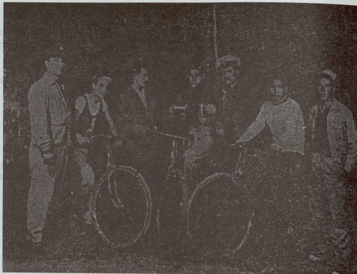
IV Carrera Ciclista corrida de San Angel a Sabinas Hidalgo