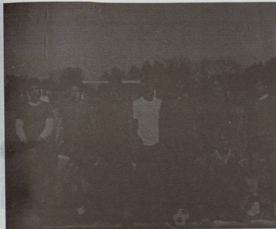
Equipo de Fútbol "Bella Vista" Subcampeón del VIII Campeonato Municipal de Mayores. Se jugó en Bella Vista a mediados de 1966. Este mismo equipo lo patrocinó el IMSS en 1966 y fue campeón.

El 1o. de Octubre, se inauguró el IX Campeonato Municipal Mayor, participaron las oncenas de El Buche, Preparatoria # 5, la AJEF y Bella Vista.