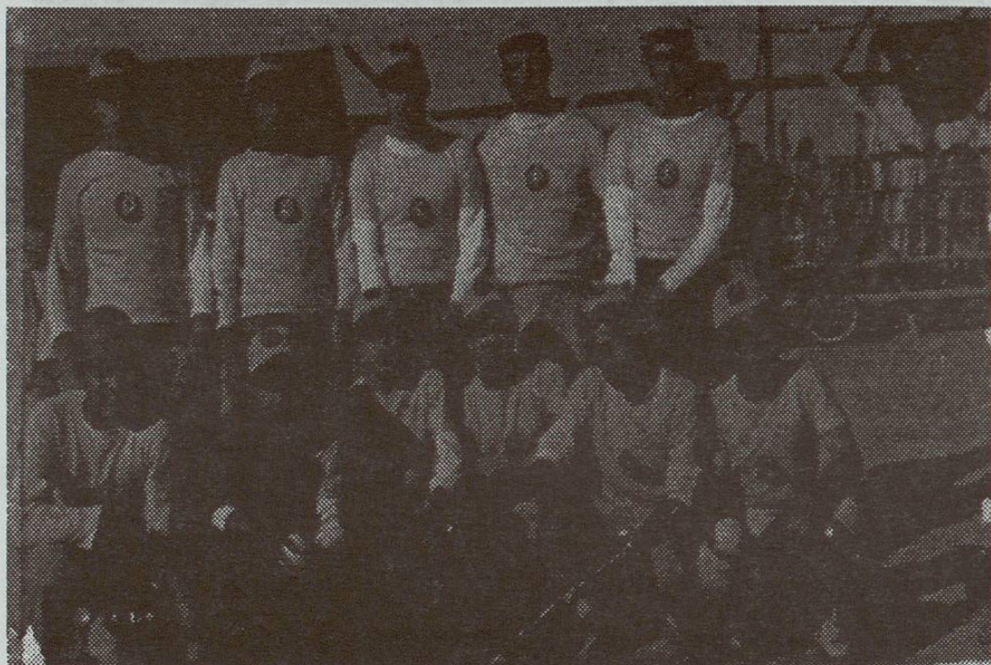
Equipo de Softbol Club de Leones, A.C. Cuarto Lugar del I Campeonato Municipal en Bella Vista Categoría Mayores 24-03-1955