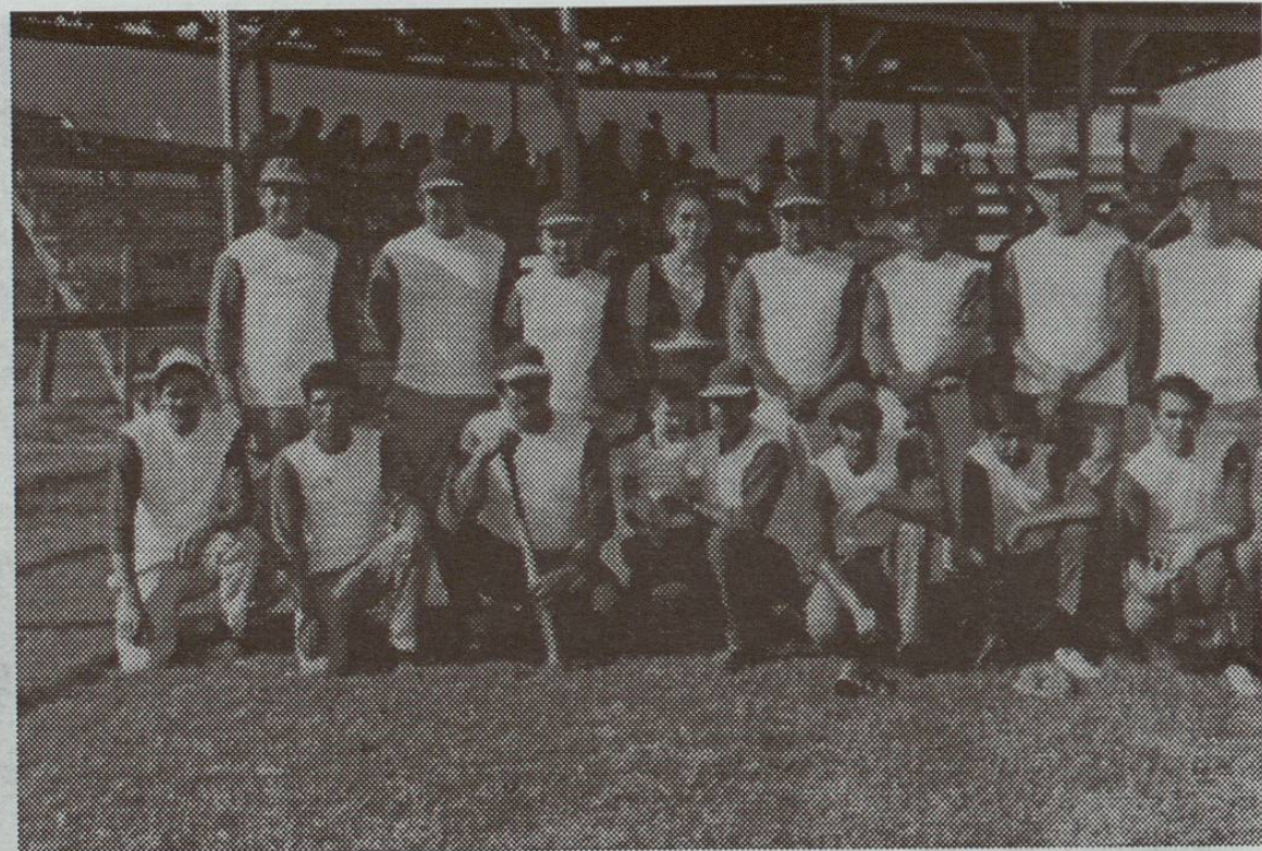
Equipo de Softbol Centro de Seguridad Social # 4. Participante en el Campeonato Municipal de Mayores. Parque de Pequeña Liga de Béisbol Profr. "Daniel Guadiana Ibarra". Noviembre de 1972.