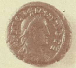
Tetradracma de Philippos II, bronce romano colonial 247-249 d.C. Busto del emperador, leyenda: ΠΙΛΙΠΠΟΣ

Después de extenderla por todo el Oriente, los griegos llevaron la moneda a Etruria, Sicilia y Campania; hicieron lo propio en Marsella y Ampurias, en España, y en África. Las conquistas de Alejandro Magno llevaron la moneda hasta la India y Bactriana, y los seléucidas la introdujeron en Arabia y entre los partos. Posteriormente, los romanos llevaron la moneda a los lugares en que no lo hicieron los griegos.