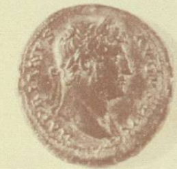
As en bronce de Adriano, 117-138 a.C. Leyenda: ADRIANUS AUGUSTUS. Busto del emperador.