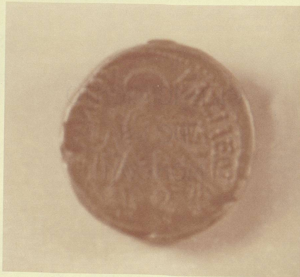
Tetradracma en plata de Ptolomeo IV, 221 a.C. Leyenda: ΒΑΣΙΛΕΟΣ ΠΤΟΛΕΜΑΪΟΥΣ, Ptolemayos basilis.

Para el desarrollo de sus actividades comerciales, el hombre inventó la moneda. Sin embargo, anteriormente, había recurrido al intercambio de especias a las que se atribuía valor similar, así como al intercambio de metales preciosos por artículos diversos, como ocurría en Egipto, Caldea y Asiria.