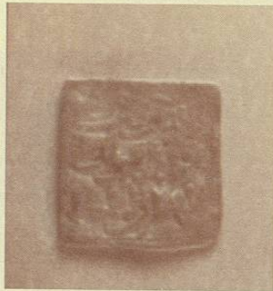
Dirham en plata cuadrada, Kalifato de Granada, España, 646 de la Hégira, 1260, Alfonso X, el sabio.