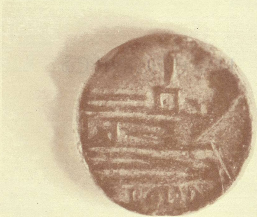
As, 167-155 a.C. República Romana, Leyenda: ROMA. Quilla de barco, altar con águila en reposo.

En esta misma época aparecieron los epígrafes en las monedas. En un principio, se redujeron al monograma de la localidad, pero posteriormente aparecieron los nombres de los magistrados y, en algunos casos, las fechas.