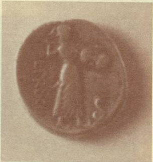
Denario de Proclia, 103 a.C. República Romana, Leyenda: L. PROCIL. F Diosa con lanza y ofrenda en mano derecha, serpiente en el piso.

La segunda versión indica que el inventor de la moneda fue Fidón de Argos y de Egina.