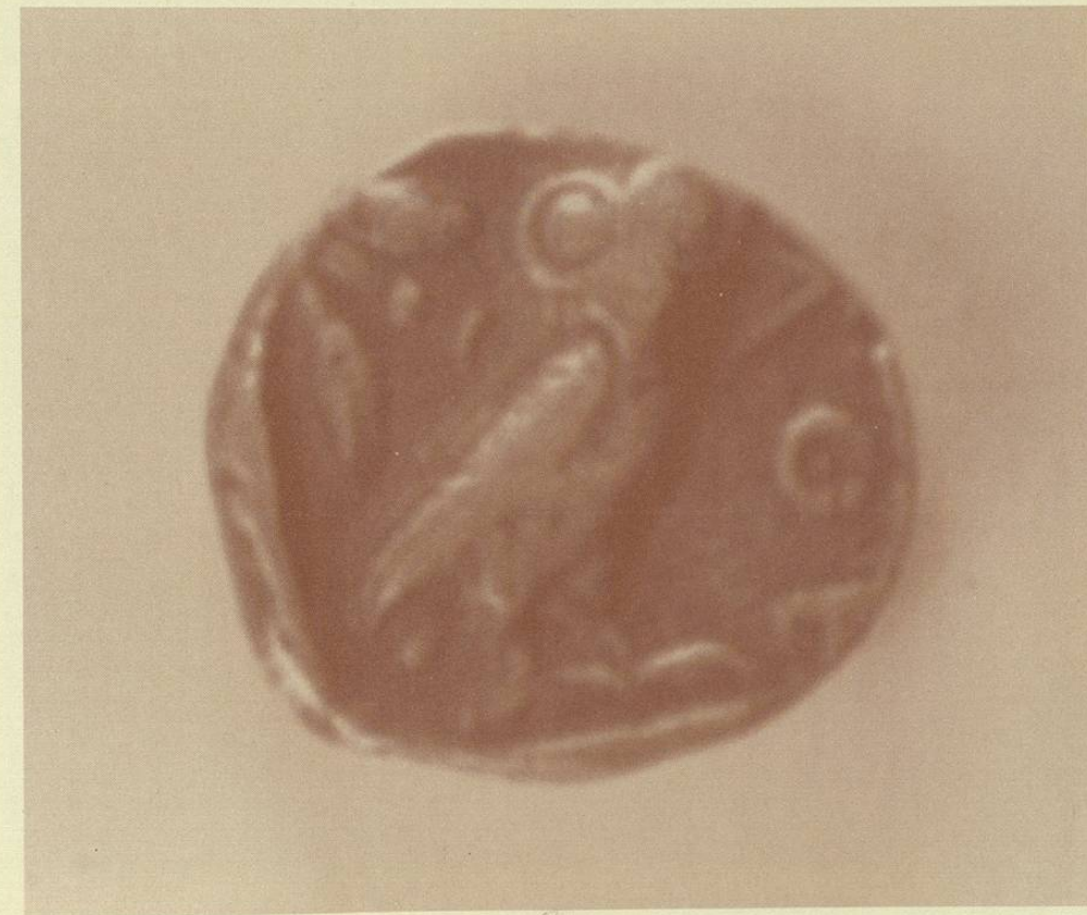
Tetradracma en plata de Atenas, 454 a.C. Leyenda: AΘE, búho símbolo de Atenas ATE (abreviación de Atenas), primer epígrafe en moneda acuñada.

El rey persa, Darío, copió estas monedas y acuñó las propias en oro, con un peso de 12.5 gramos. Todo indica que esta acuñación ocurrió poco después de la conquista de Lidia por los persas. En tales monedas aparece el rey con lanza y arco. Estas monedas llevaban una incusión, consistente en un hueco, por el reverso, del mismo cuño del frente, en relieve.