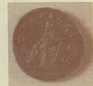
Antoninianus en plata de Philip, el Árabe, 244-249 d.C. Leyenda: LAETITIA AUG. S.C. La pureza de pie con corona de laurel a la derecha.