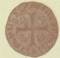
Doblón de Henry III, 1588, escritura latín uncial, cruz al centro.