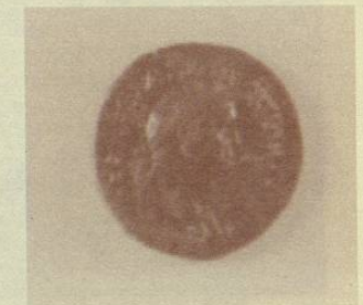
As en bronce de Vespasiano Augusto, 74, IMP VESPASIANO AUG.

El historiador Herodoto consigna: "Los primeros entre los hombres, a nuestro saber, que han batido monedas de oro y plata fueron los lidios". Por su parte, Jenofonte de Colofón afirma que el primero que acuñó monedas fue el rey lidio Jijes y, posteriormente, Cresos, en forma de lingotes de oro y de plata.