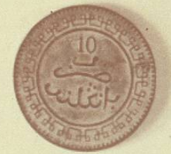
Diez Dirham de Mustafá I, 1321, de la Hégira.