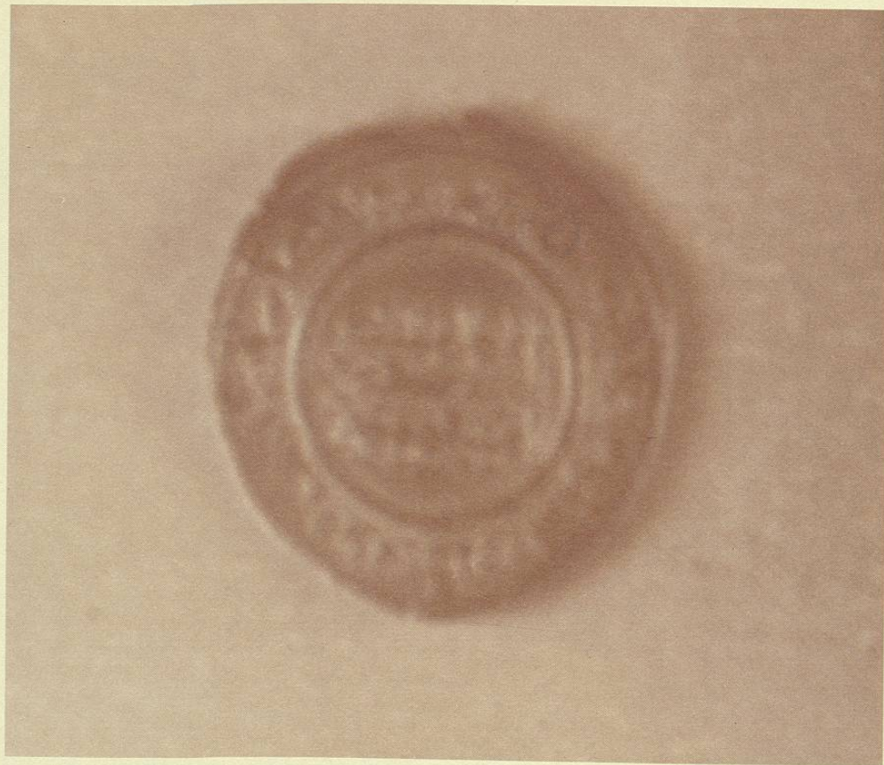
Dinar de Plata de Abdelrhaman III. Kalifato de Sevilla, 317 de la Hégira.