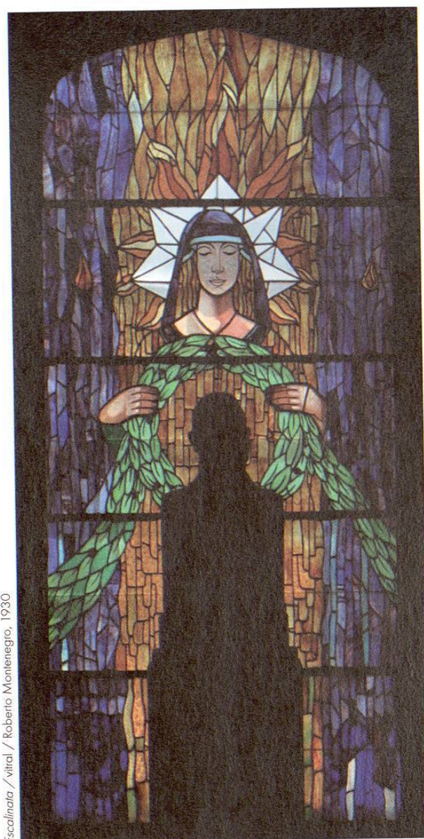
Escalinata / vitral / Roberto Montenegro, 1930

El director es la autoridad ejecutiva de la facultad o escuela y durará en su cargo tres años. Los directores podrán ser reelectos por una sola vez.