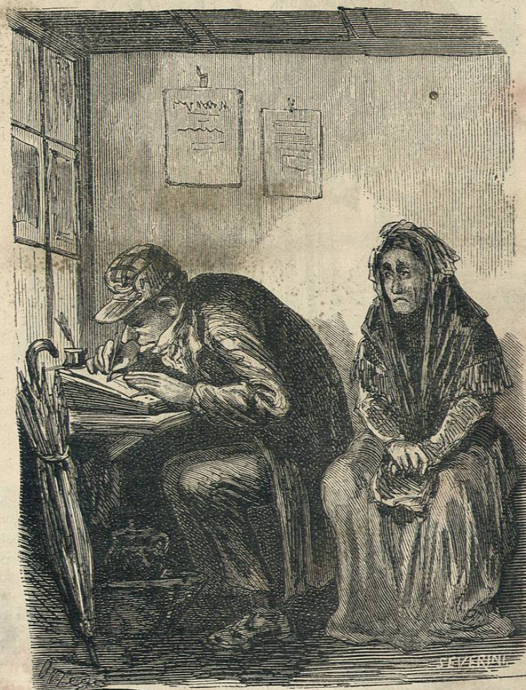
La señora que ven Vds. en el chiribitil del memorialista, cansada de no cobrar su viudedad, ha venido á Madrid y está notando una exposicion á Arderius para que la admita en los Bufos de suripanta.