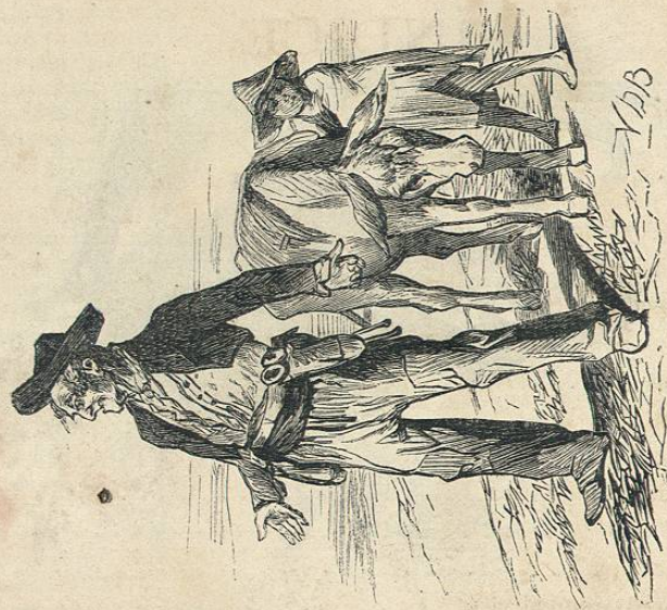
COMERCIA EN BURROS Y EN TODO LO QUE SALGA.