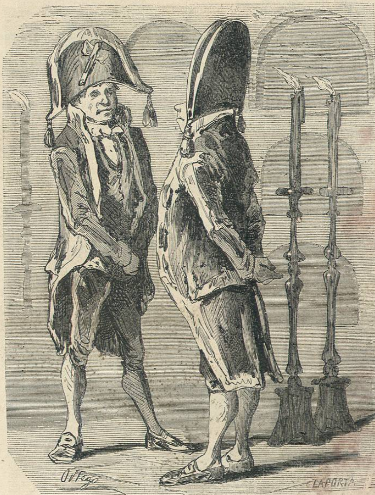
EL DIA DE TODOS LOS SANTOS.—LOS RICOS.

y aguardando que haya más, se han hecho en este año las siguientes operaciones: A plazo : los matrimonios, las deudas, la gratitud. Al contado : la virtud y los falsos testimonios; el personal ha bajado; nadie este papel codicia, pero si hubiera justicia lo habríamos visto elevado. Acciones . en general