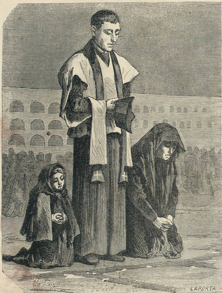
EL DIA DE TODOS LOS SANTOS.—LOS POBRES.

cansada de ser gimnasta, le ha dicho sin duda: «Basta, y ha quedado á tal altura, viendo al pueblo soberano tomarse tantos calores, que ha dejado sus valores á la altura de un enano. Los corredores, movidos por el lucro, que es su norte, corrieron tanto en la ex-córte, que se quedaron corridos. Aquello era una Babel,