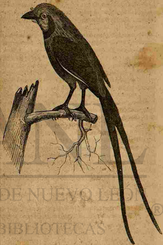
La Guberneta del Brasil.