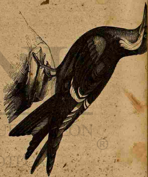
Golondrina del mar de los Incas.