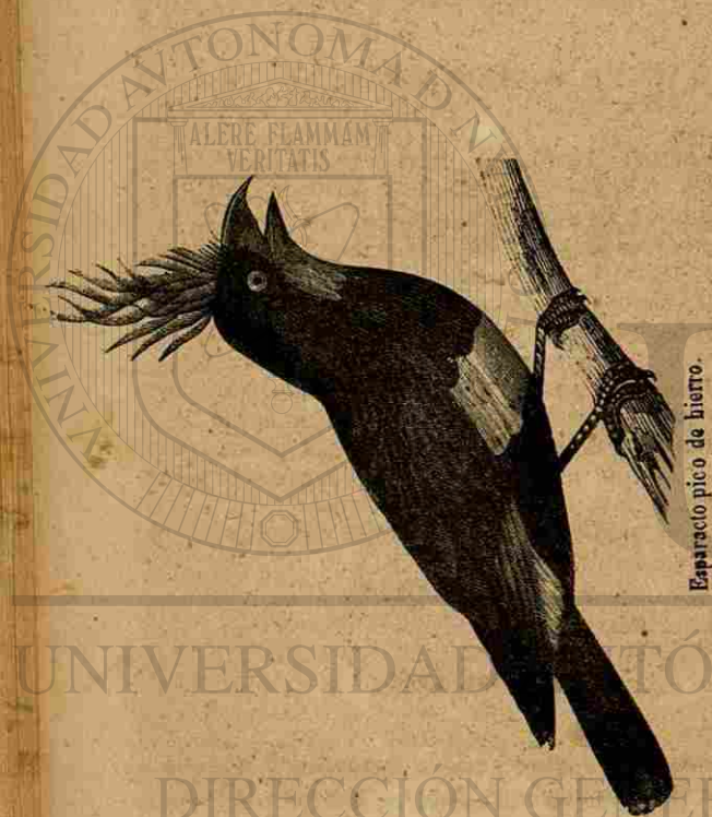
Esparacto pico de hierro.