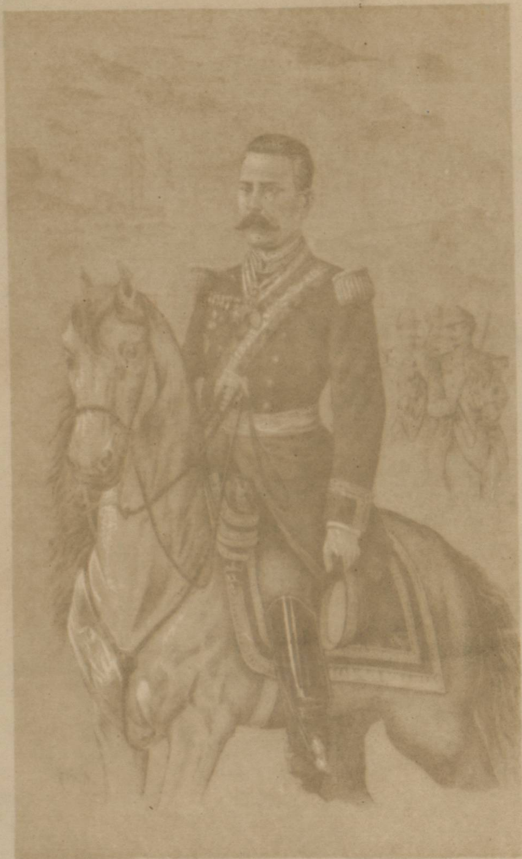
PORFIRIO DIAZ GENERAL EN JEFE