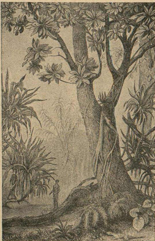
Paisaje en las Marianas.

Ya hemos dicho que de los 180.000 habitantes que hay al presente en esas islas, no llegan a 40.000 todos los indígenas, aun contando entre ellos los mestizos. Los muchos japoneses, chinos y otros extranjeros que forman parte de la población son trabajadores llevados allí mediante contratos para las faenas agrícolas e industriales de los ingenios de azúcar, cafetales, arrozales y otros cultivos e industrias que se practican en las islas. Los muchos japoneses (no menos de 60.000) que hoy residen en el archipiélago constituyen un peligro muy serio para el predominio americano. En previsión de acontecimientos futuros, tratan los Estados Unidos de fortificar algunos lugares del litoral de esas islas.