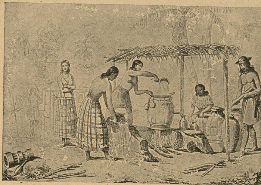
Destilería rústica (islas Marianas).

número de chinos y japoneses y poco más de un centenar de europeos. Las Palaos están al oeste de las Carolinas y son unas 26, la mayor