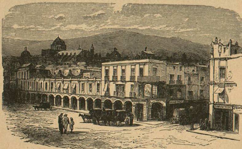
Una plaza de Méjico.

Las ciudades más populosas de la República son: Méjico, con 345.000 habitantes; Guadalajara, con 102.000; Puebla, con 93.500; San Luis de