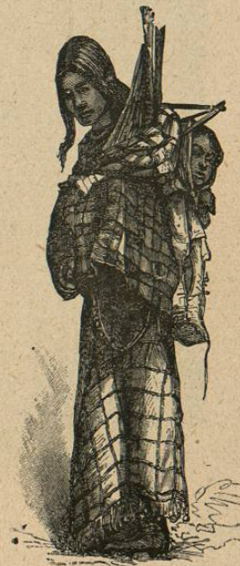
Tipo indio de la América Central.

El territorio de Guatemala es montañoso; su clima, tropical en las costas y llanuras bajas, templado y agradable en las llanuras altas o mesetas, y relativamente frío en las más elevadas de ellas, que llaman «Los Altos», las cuales se hallan en la parte nordeste del territorio. Además de los Andes cruzan el territorio de Guatemala varios ramales o estribaciones de ellos, que se llaman Sierra de las Minas, de Santa Cruz, Merendón y otras. Encuéntrense varios volcanes, unos extinguidos, otros en actividad, pero no en la cadena principal de los Andes, sino en los extremos de los ramales meridionales. Uno de ellos es el volcán de Fuego, cuya última erupción tuvo efecto en 1880, y otro, no lejano de él, el de Agua, que anegó a la segunda ciudad de Guatemala, suceso ocurrido en 1541, que tiene gran lugar en la historia de la colonización de Amé-