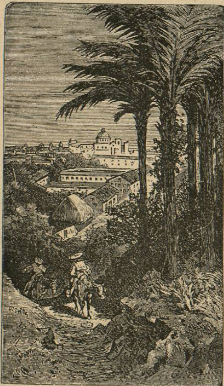
Alrededores de Guatemala.

Hallándose toda esa región en la zona Tórrida, su clima es muy cálido, especialmente en las costas. Sólo hay dos estaciones: la seca y la lluviosa. El país está cubierto en gran parte de bosques, en que abundan las más preciosas maderas. Pertenecen a su fauna el jaguar y el puma, que