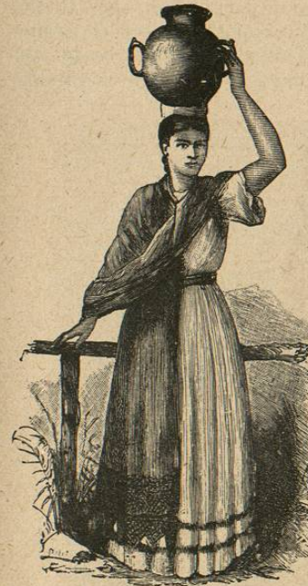
Mestiza de Guatemala.

Tiene la República varios puertos sobre el Atlántico, de los cuales el de Santo Tomás es uno de los mejores de la América Central; pero son más concurridos los llamados Puerto Barrios y Livingstone. También tiene varios sobre el Pacífico, ninguno bueno por