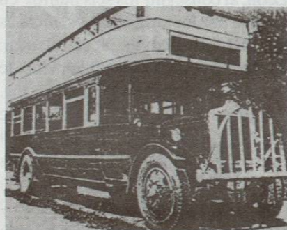
Camión que transportó al primer equipo del ITESM.