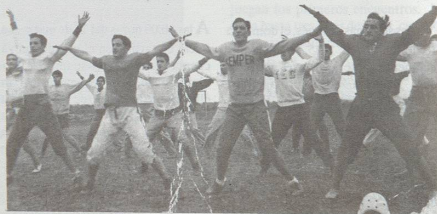
Sesión de entrenamiento del primer equipo del Tecnológico.

autobús inglés de dos pisos, vieron en una de las humildes casas que se encontraban al borde del río Santa Catarina, un borrego. De inmediato Solís pensó en adquirirlo para utilizarlo como mascota, pues hasta ese momento, su oncena no tenía ningún apodo. Entre todos se cooperaron para cubrir el precio del ejemplar y hacerse así del símbolo con el que se identifican hasta hoy en día.