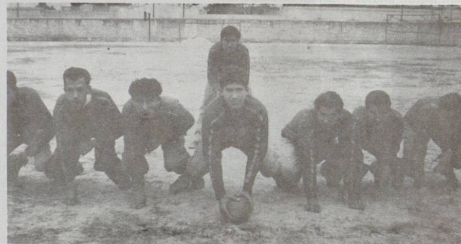
En la cancha de Bachilleres, la Universidad entrenaba para su primer encuentro en su historia.