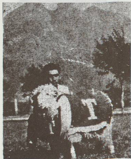
La mascota del ITESM.