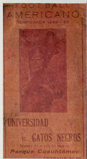
Portada del Programa del primer juego oficial de la Universidad, dentro del primer Torneo Estatal, Temporada 1944-1945.