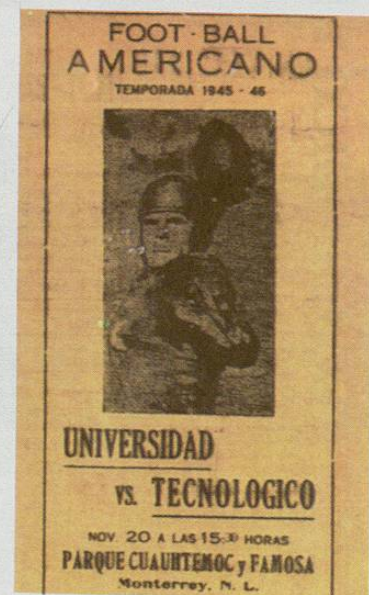
Portada de un programa del primer clásico Uni-Tec en 1945.

Alineaciones del encuentro entre Universidad Vs Gatos Negros, celebrado el 2 de diciembre de 1945, dentro del Segundo Torneo Estatal de Fútbol Americano en Nuevo León.