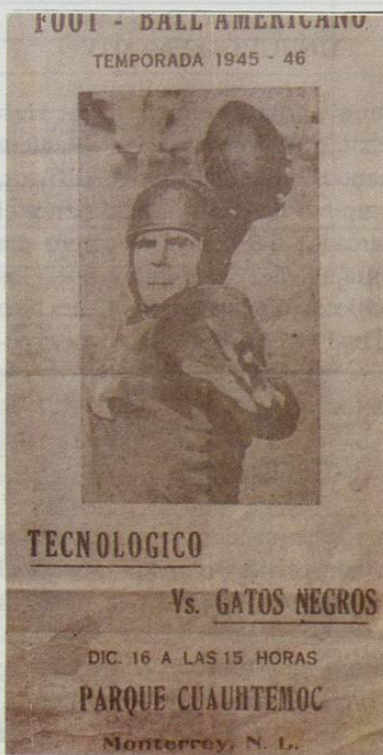
Un programa del juego entre Gatos Negros Vs Tecnológico el 16 de diciembre de 1945.