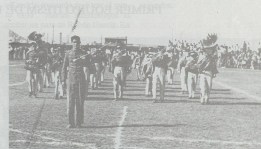
Banda del Instituto Regiomontano, que actuó en el medio tiempo del juego inaugural el 18 de enero de 1947.

El ingeniero Raúl Alvarez Encarnación, entrenador del Tecnológico de Monterrey, propuso que se imprimiesen folletos para darles a los espectadores una explicación clara del juego, sugerencia que le fue aceptada por los directivos, aprobándose también el formar "porras", adoptar himnos y presentar en los juegos algún espectáculo. En la UNL, 3702 alumnos estaban inscritos.