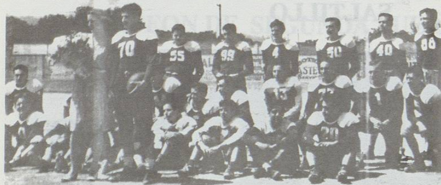
Tecnológico de Monterrey, junto a su madrina en el campo del Estadio Municipal de Saltillo, unos minutos antes de su encuentro contra los Buitres de Agricultura, el 25 de mayo de 1947.