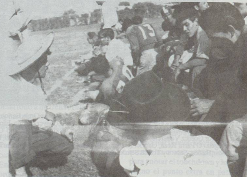
Durante el juego de Ingeniería Civil Vs Agricultura, el 26 de octubre de 1947 en el Estadio Municipal de Saltillo.

Ante dos mil asistentes reunidos en el Campo Militar de la ciudad de Saltillo el 19 de octubre, los Buitres de Agricultura vencieron 21-0 a Suspi-