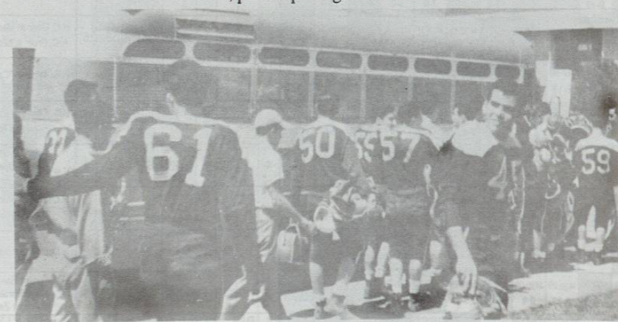
Los jugadores del Tecnológico subiendo al camión que los trasladó a los diversos escenarios de la Liga Intermedia.

La Sociedad de alumnos del ITESM hizo un reconocimiento público a su equipo del Tecnológico, considerando entre otras cosas, que el campeón era aquel que no había sufrido ninguna derrota, ni haber recibido punto en contra, por lo que seguían considerand-