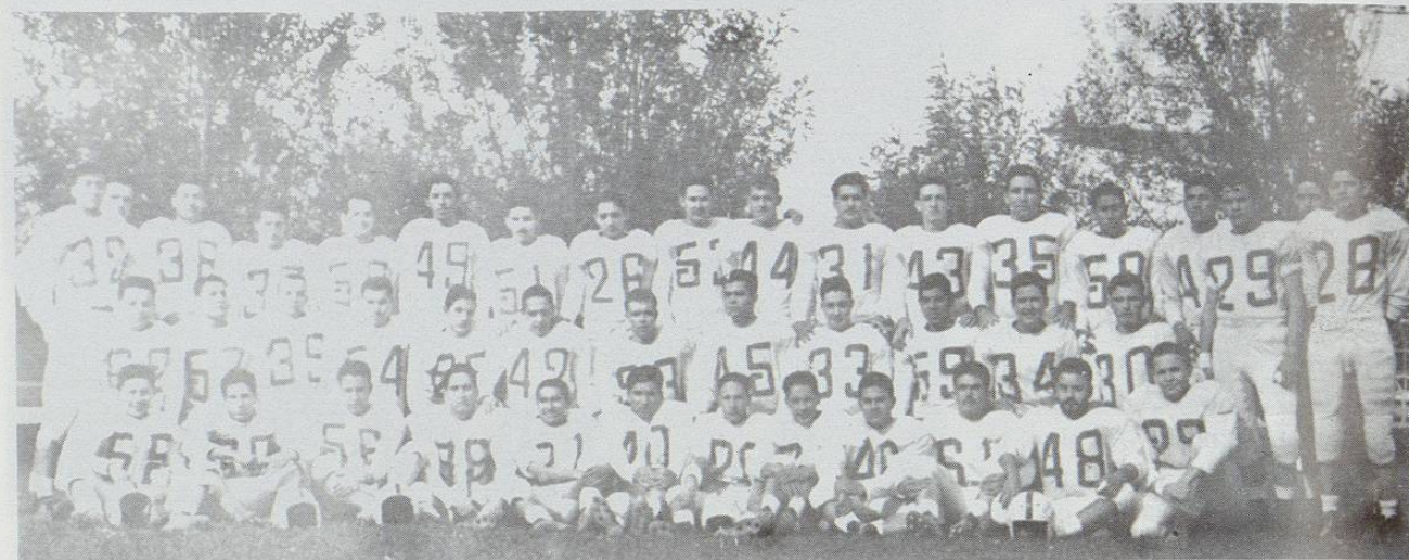
Borregos de 1953.